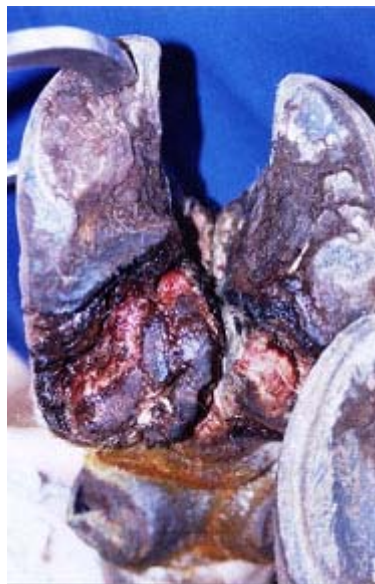
FIGURA 2. Aspecto da dermatite digital bovina, forma erosiva ou ulcerativa, após um ano de evolução clínica. Observa-se área de erosão nos talões, sola e região axial dos dígitos.

“amora”, o que corresponde às descrições de DEMIRKAN et al. (2000) e MAREGA (2001).