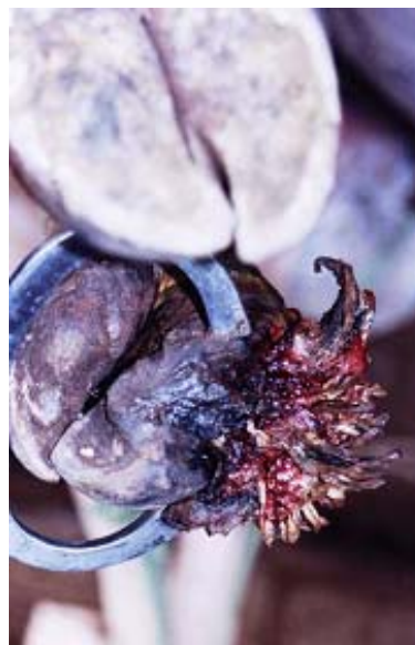
FIGURA 3. Aspecto da dermatite digital bovina, forma proliferativa verrucosa, após um ano de evolução clínica, onde se vêem tecido verrucoso, espículas com cor variando de enegrecidas a brancas e destruição do tecido córneo.