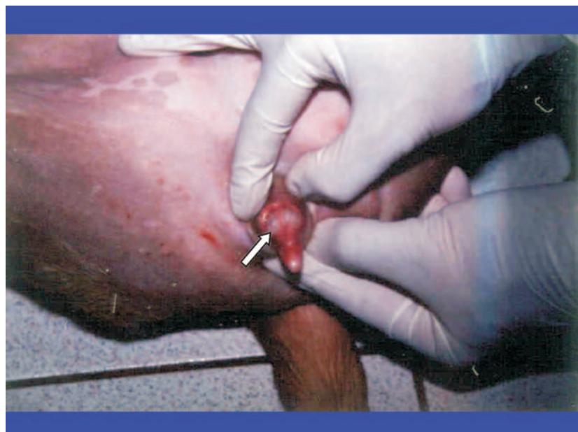
FIGURA 2. No detalhe é observado clitóris peniano. Verificar o bulbo (seta).