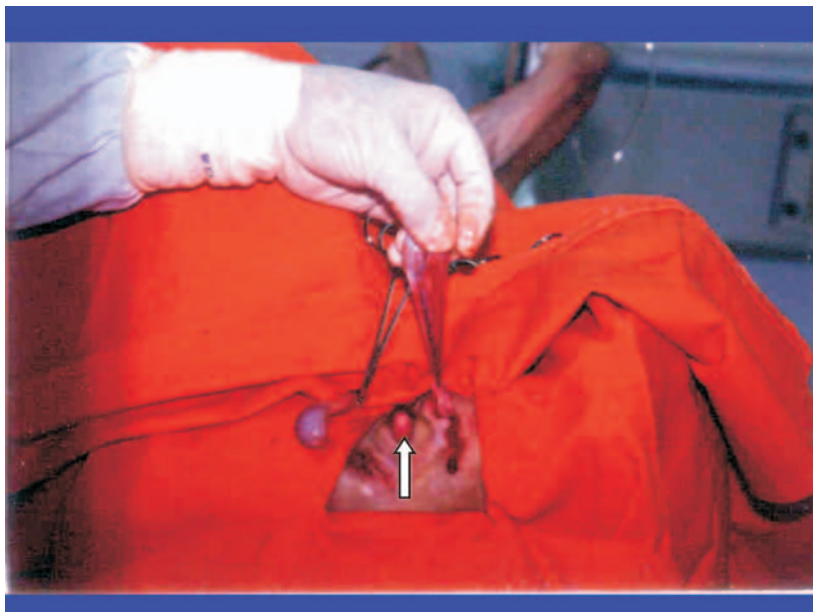
FIGURA 3. Remoção cirúrgica dos testículos observando o clitóris peniano (seta).