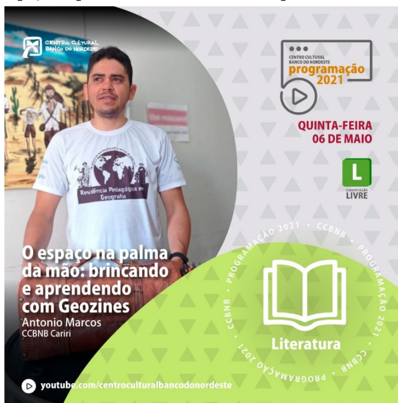
Figura 6 Oficina: O espaço na palma da mão: brincando e aprendendo com Geozines, CCBNB.

Neste campo de saber que abrange a educação geográfica e as formas de ensino destes na escola indicam que as escolhas metodológicas e o manuseio de materiais e recursos didáticos, bem como pelas colocações e exemplificações dos professores precisam levar em consideração a pluralidade em sala de aula, do universo diverso dos alunos, pois são a partir destes diagnósticos que há lógica e coerência entre os conteúdos, objetivos e metodologias de ensino. E, considerando as plataformas digitais que armazenam virtualmente as produções que versão para o melhor na sala de aula, constitui-se de maneira construtiva a ampliação e divulgação da ciência com arte. Assim a experiência de realização de oficina pedagógica sobre Geozines (Figura 6) de modo virtual através do YouTube do Centro Cultural do Banco do Nordeste -CCBNB amplia as possibilidades de formação.