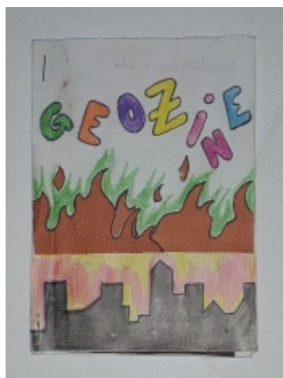
Figura 4 Geozine produzido na SEMAGEO-UECE.

As cores saltam criativamente, na imagem (Figura 4) abaixo a vida é colorida como as paineiras do romance ‘Música ao longe’ de Érico Veríssimo. Na base um contorno urbano de uma cidade acinzentada, dela vem uma combinação de cores rosa e amarela. No centro da imagem um contraste onde vê-se a representação de labaredas avermelhadas e marrons e um pouco mais acima como se fosse um sombreado seguindo as labaredas a cor verde. Letras garrafais pintadas manualmente em verde, laranja, roxo, amarelo, lilás e azul trazem o nome Geozine.