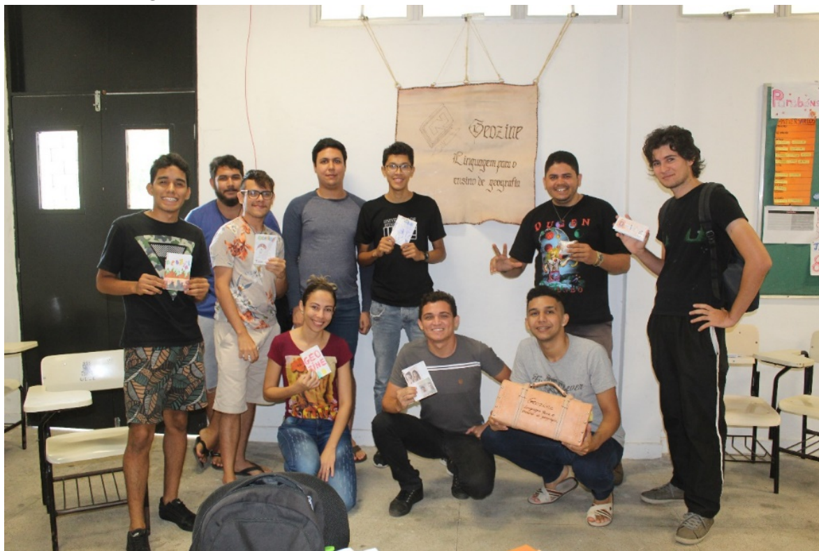
Figura 5 Minicurso sobre Geozine SEMAGEO-UECE.