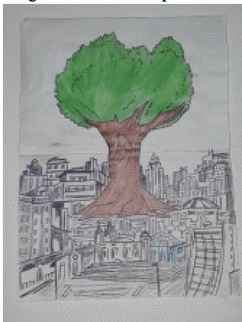
Figura 2 A cidade respira?

técnica do taumatrópio 7 que quando movimentada dá origem outra, ou seja, quando há derrubada das árvores com as queimadas, por exemplo, ‘os moradores da zona rural sofrem’.