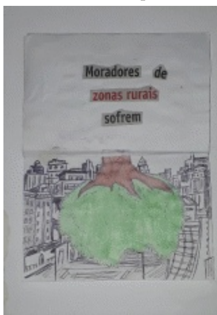
Figura 3 Técnica semelhante ao pré-cinema taumatrópio.

O professor, no seu fazer, imbuído dos saberes de Geografia e do campo da pedagogia, notadamente do campo da didática ao selecionar os conteúdos a serem ensinados, com foco na apreensão das espacialidades geográficas, que são múltiplas, os materializam com elementos diversos e contribui para o desenvolvimento do raciocínio espacial. Essa combinação aleatória lembra em alguns aspectos o movimento dadaísta que ao acionar o pensamento do improvável.