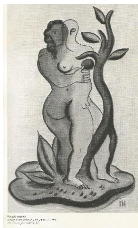
Figura 8: Ismael Nery, Pecado Original, s/d., crayon e aquarela s/papel, 26,5x17,2 cm Coleção particular Chaim José Hamer, S

Ismael Nery tinha obsessão pelo desenho de casais, cujos corpos misturados entrelaçados davam uma ideia de que os primeiros humanos tinham sido andróginos, nem homem nem mulher, eram um só ser. A divisão dos sexos teria sido consequência da queda. No desenho Pecado original , vemos um movimento em diástole, para fora: os pés e os membros inferiores das três figuras – a mulher, o homem e a árvore antropomórfica –, ainda se encontram unidos, porém, em posição de avançar. Eva agarrada às costas de Adão, o quadro retrata os segundos que antecedem a queda do “homem”, a separação da natureza, a maldição da divisão dos sexos e a perda do Paraíso.