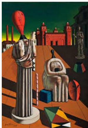
Figura 2: Giorgio de Chirico. As Musas Inquietantes. 1916-1918. Óleo sobre tela. 97 x 66 cm Coleção Particular. Fonte: Disponível em:

https://www.wikiart.org/pt/giorgio-de-chirico/the-disquieting-muses-1918-1