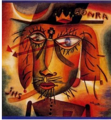
Figura 6: Xul Solar. Jefe Honra, 1923. Aquarela sobre papel. 28 X 26 cm Fonte: (Gradowczyk 1994, 89)

conferências de Rudolf Steiner, Xul pintou aquarela cristológica, Jefe Honra , cujos olhos cheios de estupor nos impressionam, num rosto de Cristo crivado de espinhos. A figura de Cristo foi tema reiterado no pensamento de Steiner. O verdadeiro cristianismo, dizia Steiner, é uma vivência que se expressa através de uma experiência pessoal. Steiner enfatizava que, com o passar dos tempos, mais gente poderia viver como Cristo, como ser espiritual, independente de toda igreja (Albós 2004, 101).