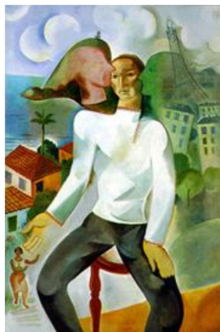
Figura 1: Ismael Nery. Autorretrato. 1927. Óleo sobre tela, 129/83 cm Col. Domingo Globbi, S Fonte: Catálogo, 1984, 172

Essa “pretensão metafísica”, que já aparece no Prólogo indispensável do livro, no qual Marechal apresenta “Adán Buenosayres desde seu despertar metafísico...”, foi a pedra de toque inicial para minha primeira intuição de que estava diante de um linguagem estética comum à cosmovisão dos artistas argentinos - Leopoldo Marechal e Xul Solar – e do artista brasileiro Ismael Nery. O fio que enlaça o pensamento dos três tem base na estética metafísica, uma crença de que a existência do indivíduo transcende a realidade contingente, no tempo e no espaço. Por exemplo, no Autorretrato de IN , de 1927, que Ismael Nery pintou no ano em que estivera em Paris, vemos ao centro a figura do artista sentado numa cadeira que divide o quadro em dois espaços, à direita, uma paisagem parisiense com a Torre Eiffel e, à esquerda, o Pão-de-Açúcar representa a paisagem carioca. Sobrepostas à Torre Eiffel e ao Pão de Açúcar, perfis de Ismael refletidos no mesmo nível do seu rosto, no centro do quadro. Uma concomitância temporal e espacial para expressar sua ideia de tempo e espaço. Escrito no verso, aparece a seguinte frase: “Um homem que se estudar em um momento, não se conhecerá... O presente de um homem é o resultado do seu passado e do de seus antepassados...” (Nery, apud. Fernandez 1984, 150).