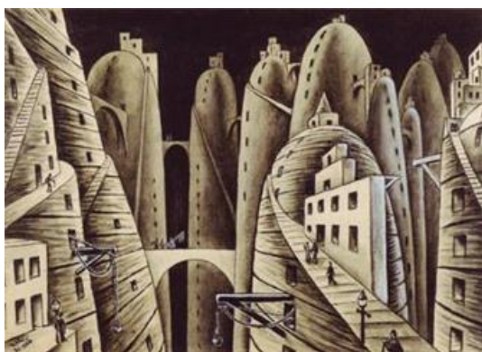
Figura 3: Xul Solar. Ciudad y abismo, 1946, t mpera sobre papel, 35 x 50 cm

Antes de partir para a Europa, em 1912, Xul sentia-se isolado e incompreendido em Buenos Aires, que lhe parecia miserável. Sua angústia chegava à beira da desesperação. Cintia Cristiá (2007, 13) mostra uma passagem na qual Xul Solar cita uma frase do poema Les Fleurs do Mal , de Baudelaire, importante para caracterizar o estado de angústia da etapa inicial do jovem Alejandro. No poema Noche , Outubro, 1910, percebemos que Xul sente-se “asfixiado em meio à agitação de desejos”; parece-lhe que “névoas inimigas mortíferas se rivalizam”; seu espírito “agita-se e se revolta pelo espaço”, procurando ajuda para fugir. “Nesta luta angustiada me farei veterano; com minhas mãos, meus olhos e ouvidos ávidos, com meu ardente cérebro encontrarei o caminho (...) se não há país sem angústia para mim, todo eu, dentro de meus pensamentos, me farei um mundo!” (Catálogo 1990, 10).