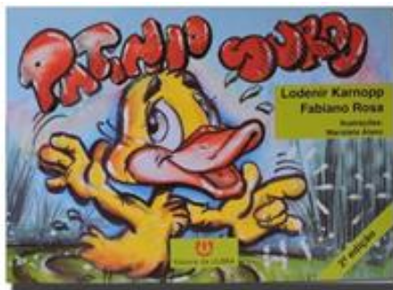
Figura 2. Capa de Patinho Surdo