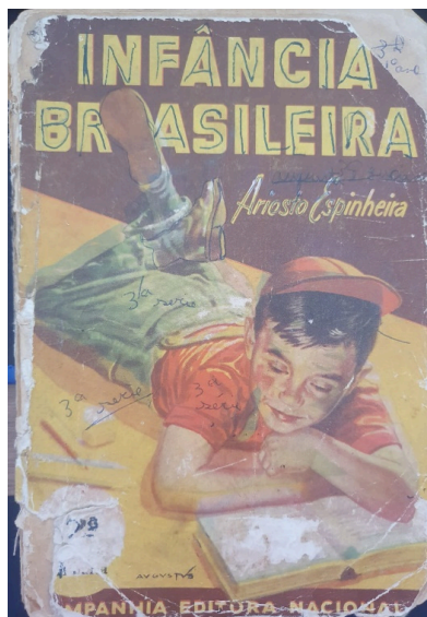
Figura 1 – Capa do livro Infância Brasileira