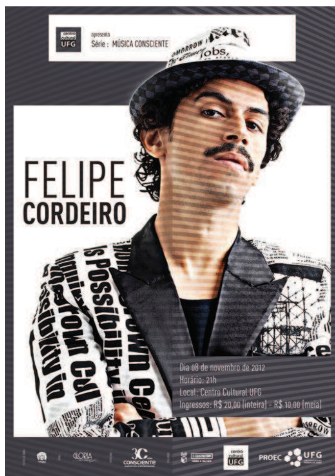
7. CCUFG, série Música Consciente, cartaz e flyer. Design gráfico: Renato Reno.