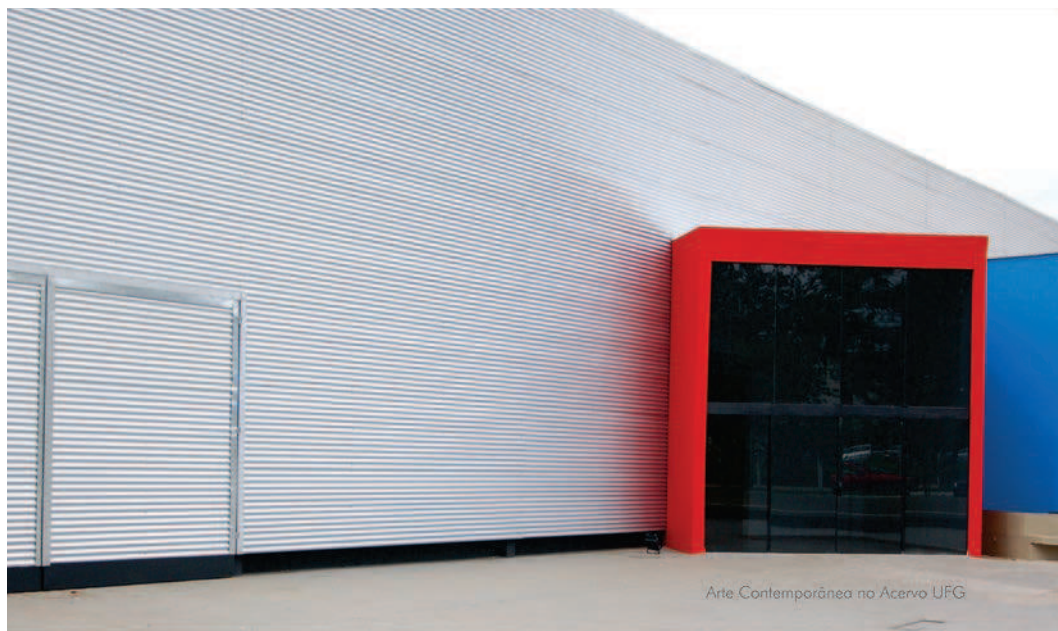
9. CCUFG, catálogo "Arte Contemporânea no Acervo UFG", 2010. Foto da capa: Paul Setúbal. Design gráfico: Sarah Ottoni.