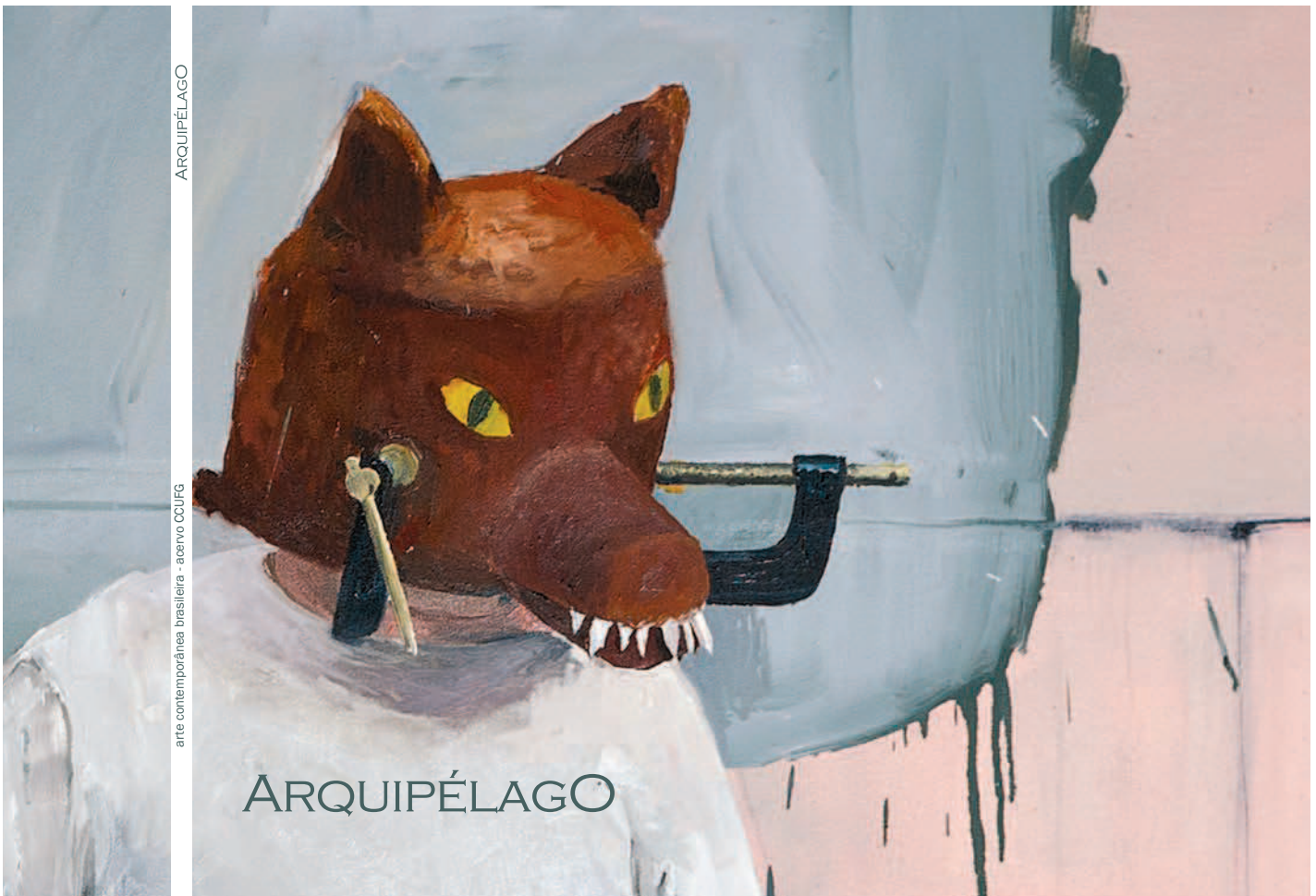
11. CCUFG, catálogo, "Arquipélago", 2013. Capa: pintura de Eduardo Berliner. Design gráfico: Carla Abreu.