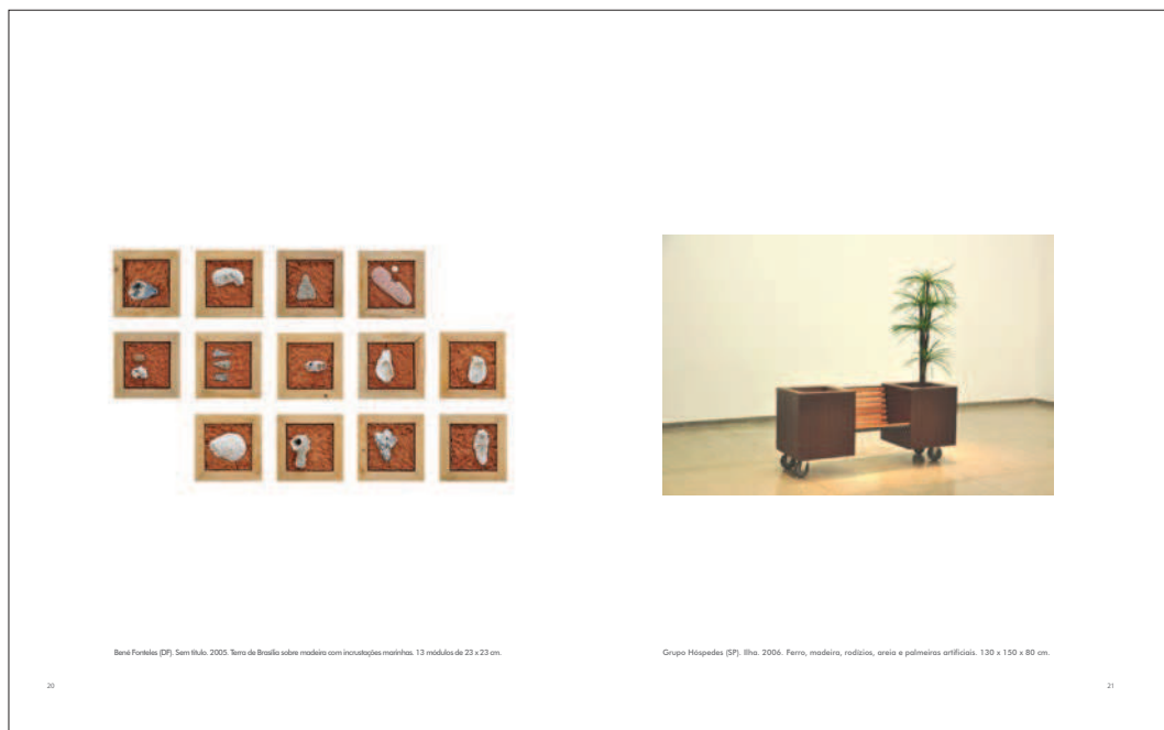
10. CCUFG, catálogo, 2010. Página dupla do miolo. Foto: Paul Setúbal. Design gráfico: Sarah Ottoni.