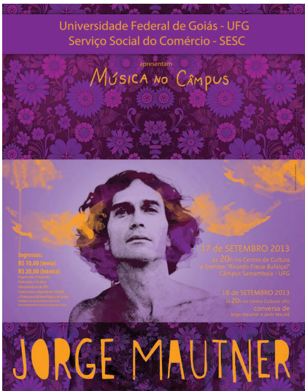
4. Projeto Música no Câmpus, cartaz, 2013. Design gráfico e ilustração: Sarah Ottoni.