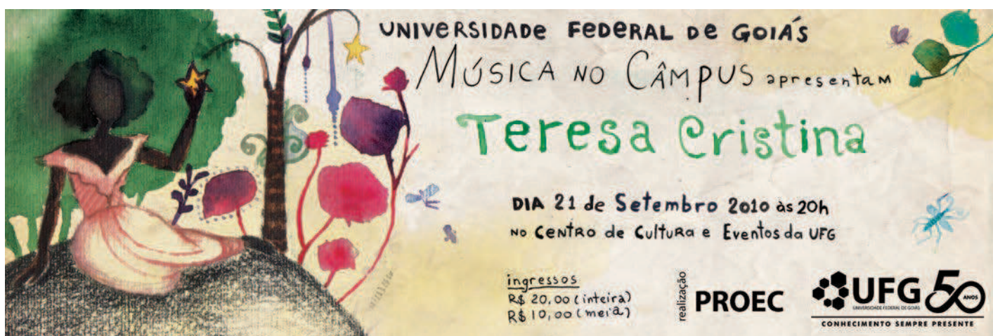
2. Projeto Música no Câmpus, outdoor, 2010. Design e ilustração: Sarah Ottoni