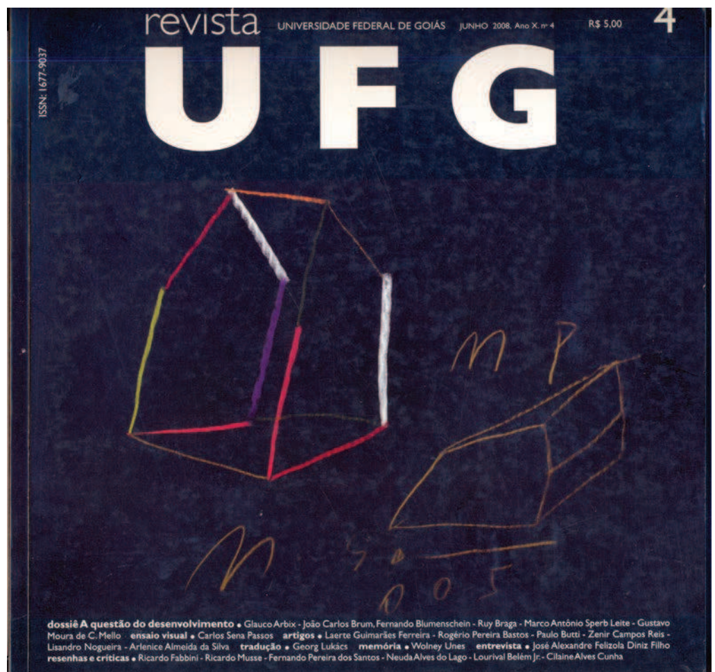
8. Capa da Revista UFG n° 4, 2008. Desenho de Marcelo Solá. Design gráfico: Elyeser Sturm e Kollontai Diniz.