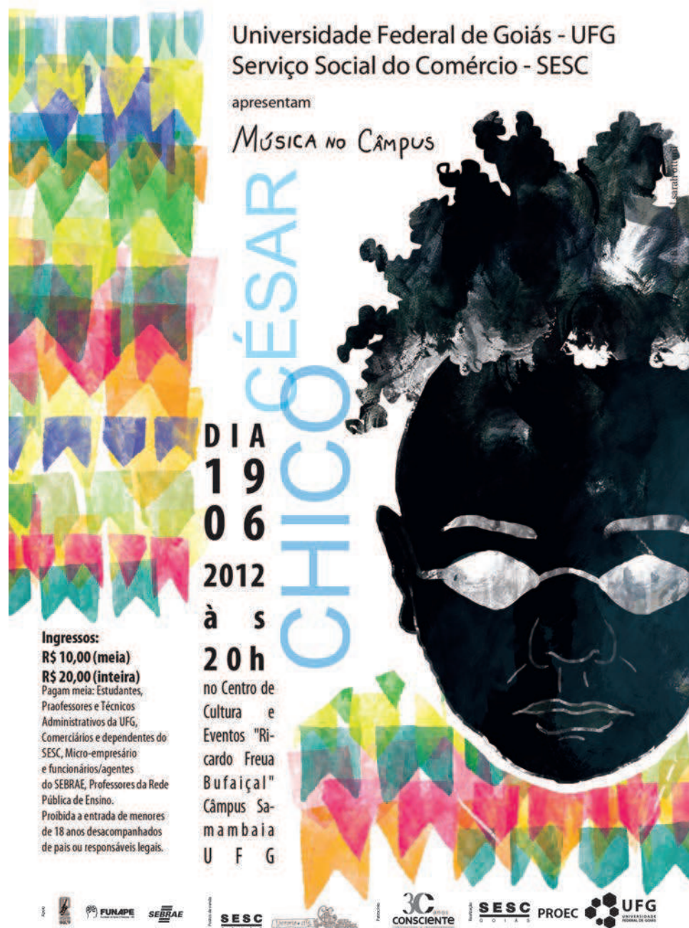
5. Projeto Música no Câmpus, cartaz, 2012. Design gráfico e ilustração: Sarah Ottoni.