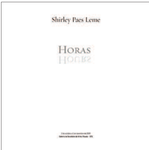
14. Catálogo exposição "Horas" Shirley Paes Leme, Galeria da FAV, 2009. Fotografias: Alana Borges e Shirley Paes Leme. Design gráfico: Angela Mendes.