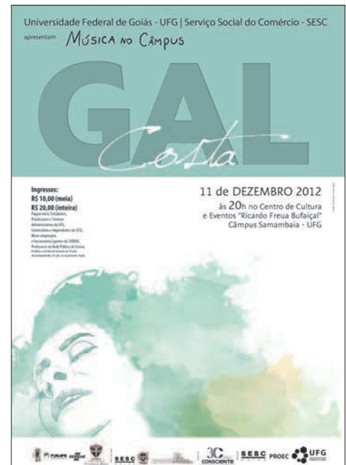
3. Projeto Música no Câmpus, cartazes. Design e ilustração: Sarah Ottoni.