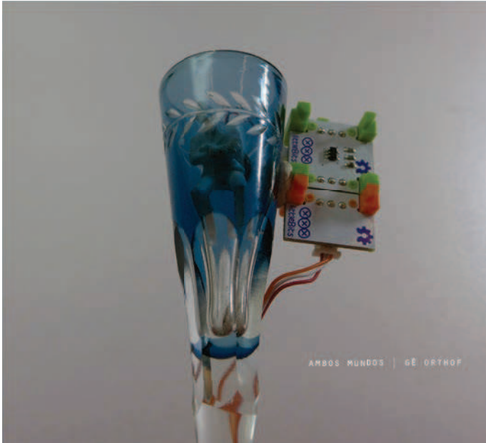
12. Catálogo exposição "Ambos Mundos", Galeria da FAV, 2013. Capa: foto de objeto instalação de Gê Orthof. Design gráfico: Julia Milward e Gê Orthof.