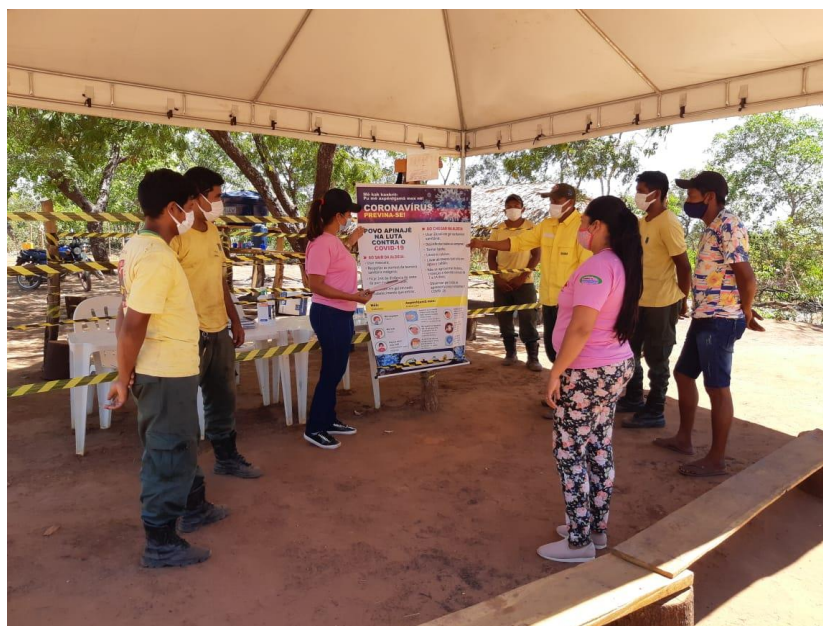
Figura 10 – Orientação em Barreira Sanitária