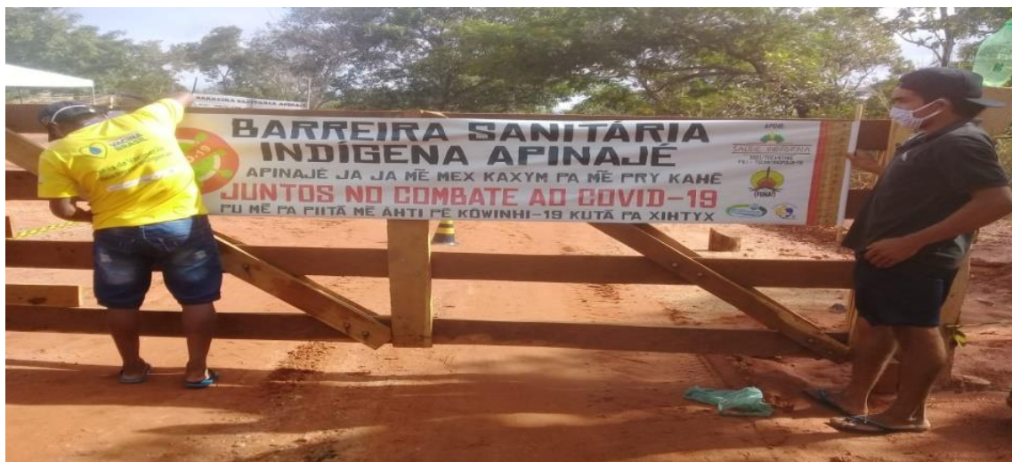
Figura 4 – Barreira Sanitária na aldeia Mariazinha na TO-126