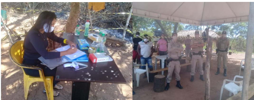
Figura 6 – Barreira Sanitária

Para sairmos do território, um membro vai até as barreiras sanitárias para fazer o agendamento de futuras saídas explicando os motivos. Quem retorna da cidade passa por higienização de seu automóvel, assim como as compras são higienizadas. Controlamos temperaturas de saída e chegada que são anotadas numa planilha de controle quando se entrega crachás. Neste momento, recebe-se orientações de cuidados no retorno à aldeia, como tomar banho, separar e lavar as roupas que usou lavar a máscara que usou, não permitir as crianças brigarem com as máscaras, higienizar sempre as mãos com álcool em gel e higienizar item por item antes de consumir ou guardar.