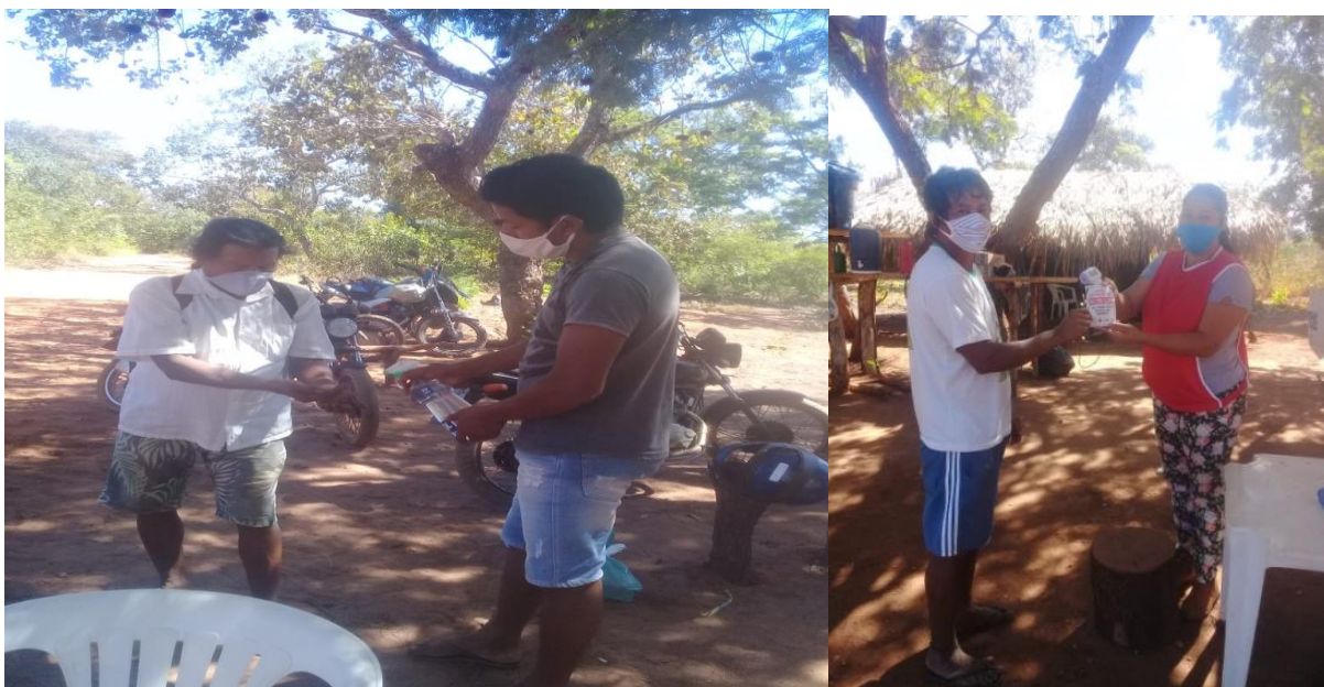
Figura 7 – Saída e entrada da aldeia passando álcool em gel e entrega de crachás