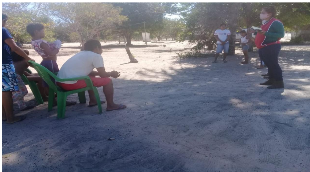
Figura 2 – Aldeia Patizal recebendo orientações pela equipe volante

Necessitamos ainda comprar alimentos na cidade porque nossa mata, rios e córregos têm diminuído ano a ano e a caça e os peixes estão se tornando mais difíceis de serem encontrados. Nosso território é cercado por municípios, fazendas e empreendimentos, como plantações, desmatamentos e grandes barragens para hidrelétricas no Rio Tocantins, que afetam intensamente os ecossistemas do Cerrado.