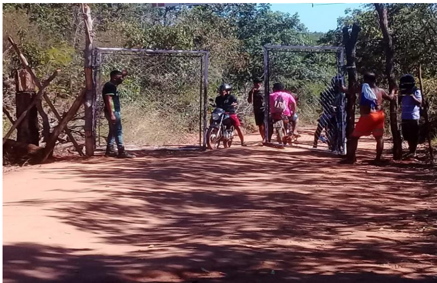
Figura 3 – Barreira sanitária aldeia São José na Rodovia Transamazônica

fecharam assim as duas pontas de acesso ao território, pelo lado da aldeia Mariazinha e pelo lado da aldeia São José. Fizemos o círculo de proteção das aldeias.