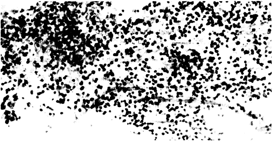
Fig. 1 - Linfonódio de bovino

O exame microscópico revelou os linfonódios mesentéricos com intensa necrose, atingindo tanto o centro germinativo como a cortical. Na periferia das áreas necróticas, observaram-se alguns infiltrados de células epitelióides (macrófagos). Em diversos pontos podia-se notar a presença de "Hifas" não septadas, grosseiras e basófilas (Fig. 1 e 2).