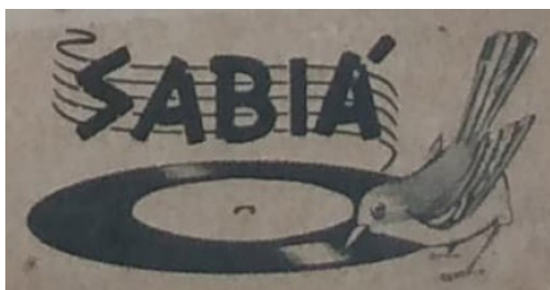
Figura 11 – Logotipo do selo fonográfico Sabiá

de suas viagens pelo Brasil e exterior foram apoiadas por seu amigo Omar Fontana, herdeiro da empresa alimentícia Sadia e fundador da companhia aérea Transbrasil, e pelo magnata das comunicações Assis Chateaubriand (Frisch, 2005, p. 48-49; 66-72). Cantos de Aves do Brasil foi lançado pelo selo fonográfico Sabiá, um subsidiário da gravadora Copacabana que até então tinha como foco principal a publicação de música caipira em discos de 78 rotações 8 , mas cujo logotipo parecia feito sob medida para o trabalho de Frisch: nele, um sabiá bica o sulco de um disco fonográfico, usando seu bico como uma agulha de toca-discos; logo acima, a palavra “sabiá” aparece escrita sobre um pentagrama musical estilizado, sugerindo um solfejo do pássaro nomeado (Figura 11). A imagem dessa vitrola-pássaro remete a uma longa relação entre aves canoras e práticas musicais, incluindo o treinamento de pássaros para o canto de melodias compostas por humanos, a criação de pássaros em gaiolas que oferecem acompanhamento sonoro para as atividades domésticas, e a transcrição de cantos de aves em partitura por compositores como Olivier Messiaen e expediçãoários como Hercule Florence.