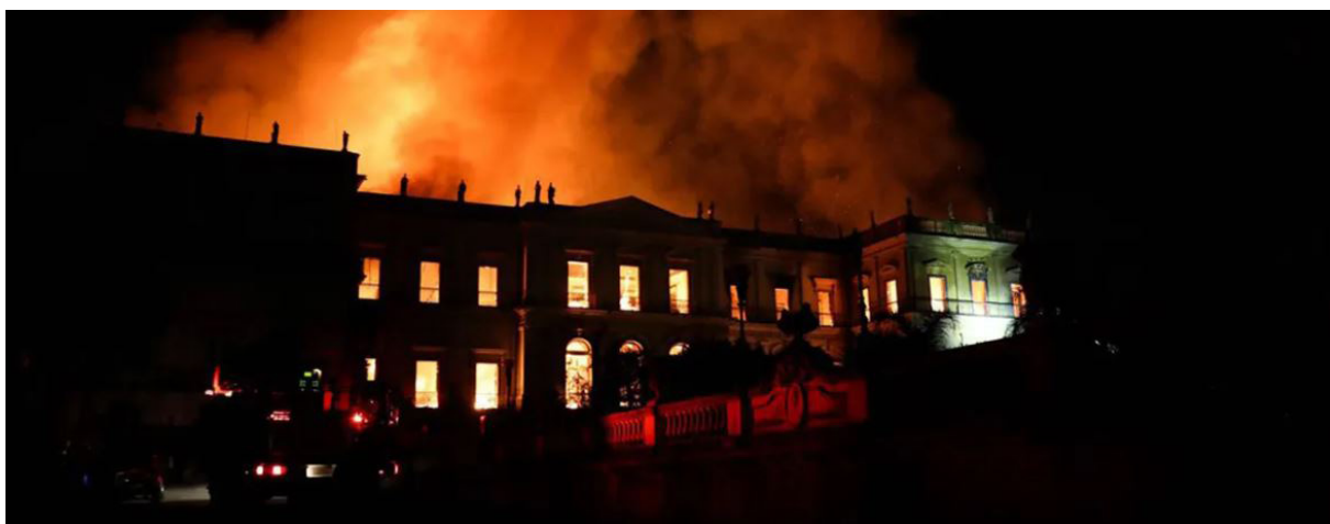
Figura 7 – Incêndio no Museu Nacional, que abrigava os cilindros de cera gravados por Edgar Roquette-Pinto.