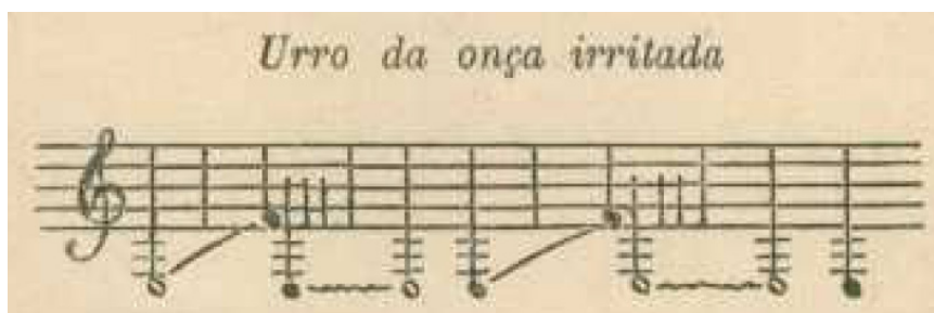
Figura 9 – “Urro da onça irritada”, transcrição de Hercule Florence, c. 1830