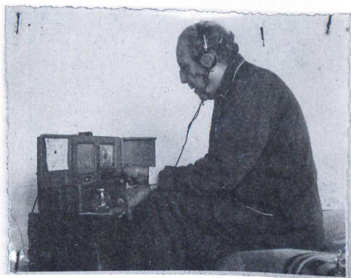
Figura 5 – Edgar Roquette-Pinto ouvindo rádio. Fotografia desconhecida, sem data

Em 1912, integrou uma expedição organizada pela Comissão Rondon em direção à Serra do Norte, que tinha como objetivo principal a expansão das linhas telegráficas pelo país. Dessa expedição, o pesquisador trouxe, além de anotações, fotografias e filmagens, dezessete cilindros de cera realizados com um fonógrafo Edison, quatorze dos quais continham gravações de músicas de indígenas Paresís e Nambikwaras (Pereira; Pacheco, 2008).