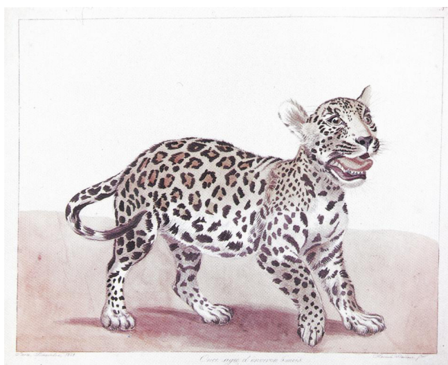
Figura 8 – “Once agée d’environ 6 mois” [Onça com cerca de 6 meses de idade], aquarela de Hercule Florence, 1828

Entre 1825 e 1829, Florence acompanhou a Expedição Langsdorff pelo interior do Brasil, saindo de Porto Feliz (SP) em direção a Belém (PA), produzindo desenhos e aquarelas da fauna, flora, de paisagens e das populações indígenas que encontravam pelo caminho (Figura 8). Após regressar da expedição, Florence dedicou-se a inventar “um método de representar por signos a voz que os animais fazem ouvir” (Florence, 1993, p. 27), recorrendo à sua memória para recuperar alguns dos cantos que ouvira durante a viagem. O método de Florence consistia na notação dos cantos em um pentagrama, geralmente acompanhado por uma clave de sol, com uma organização rítmica realizada por barras de compasso que dividem blocos de um segundo de duração (Figura 9). A respeito das limitações desse método, Florence sugere que “[m]esmo não conseguindo render os mesmos sons, pelo menos se conhecerá mais ou menos as relações que existem entre eles”, e aponta que o sistema, “como qualquer outro, aproximar-se-á o tanto quanto possível da própria Natureza” (Florence, 1993, p. 30).