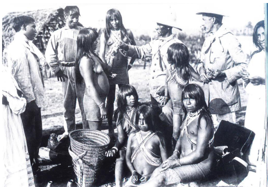
Figura 6 – General Cândido Mariano da Silva Rondon distribui presentes para indígenas Paresí. sem data

Além da gravação de músicas indígenas, o fonógrafo também teria sido utilizado pela Comissão Rondon para registrar três “lendas” Paresí, mas o material foi danificado durante a viagem (Roquette-Pinto, 1917, p. 85). No que diz respeito ao canto de animais não-humanos, entretanto, a descrição por escrito continuava sendo o método de registro utilizado. Em uma anotação datada de 15 de setembro de 1912, Roquette-Pinto escreve: “Canta a cigarra; estridúla um som redondo e cheio, como si fosse nota aguda de um mezzo-soprano. / Deve ser a cicada mannifera , que tem fama de cantora” (Roquette-Pinto, 1917, p. 101).