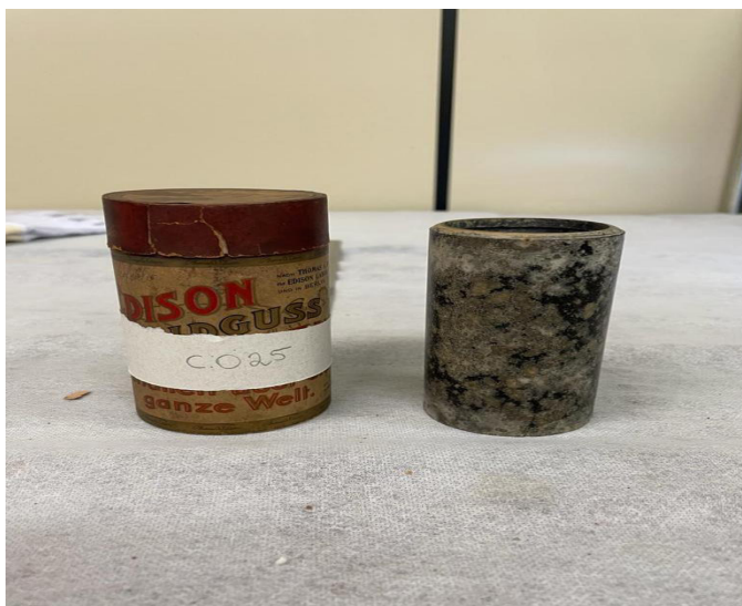
Figura 3 – Cilindros de cera com gravações realizadas por Koch-Grünberg, armazenados na Discoteca Oneyda Alvarenga, Centro Cultural São Paulo.