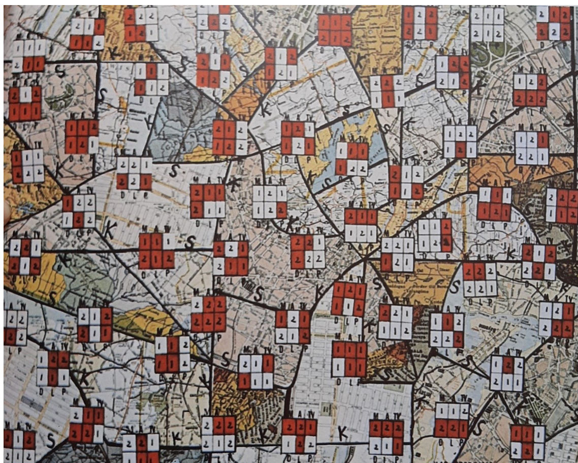
Figura 1 - Partitura-mapa de Teatro Probabilístico III.

possui um caráter apresentacional, como um concerto, mas sim participativo, na medida em que a sua finalidade é promover uma experiência que envolva ativamente todos os presentes.