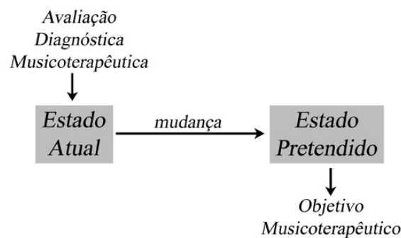
Figura 1: Representação esquemática do Processo Musicoterapêutico, no qual o paciente se engaja em uma experiência musical no contexto de uma relação terapêutica a fim de obter uma mudança em seu estado de saúde

Além da Avaliação Diagnóstica Musicoterapêutica inicial, que fornece uma compreensão do estado atual de saúde e desenvolvimento do paciente, devem ocorrer ao longo do processo clínico musicoterapêutico outros momentos em que a condição de saúde do paciente seja reavaliada, como um todo ou em aspectos específicos, para que o terapeuta possa compreender o caminho que já foi percorrido até então, bem como quais os novos passos que precisarão ser dados para ir ao encontro do objetivo terapêutico traçado. Deste modo, podem ser considerados quatro momentos em que a Avaliação Musicoterapêutica possa ocorrer: