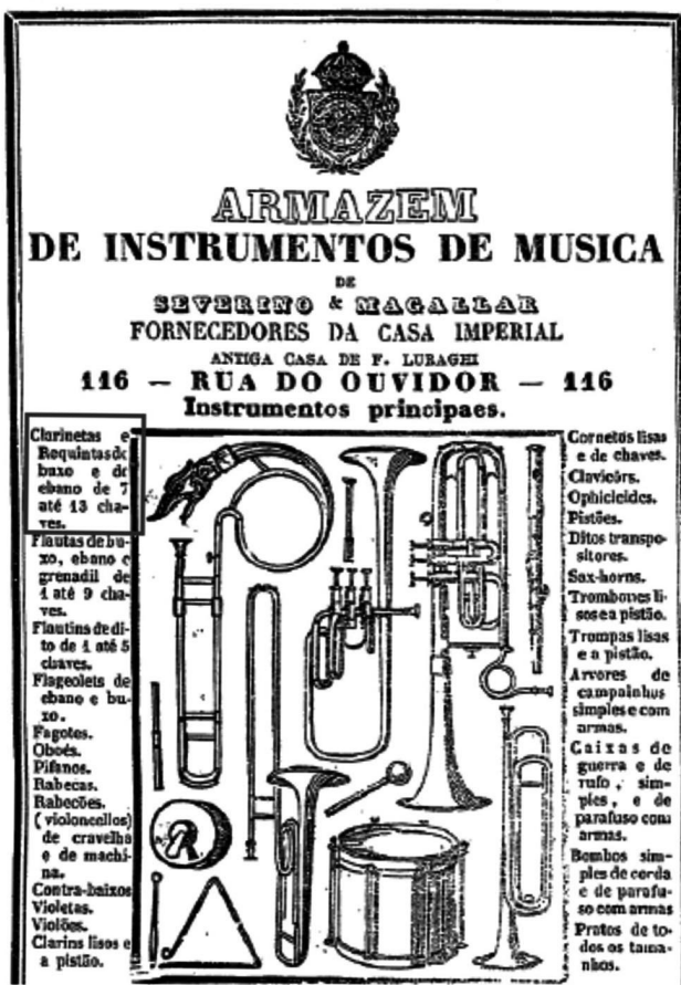
Figura 3: Anuncio de venda de instrumentos musicais do Almanak Laemmert (1859, p. 26). Em vermelho a indicação de venda de “clarinetas e requintas do buxo [boxwood] e do ebano de 7 até 13 chaves [sistema Müller]”.

No segundo documento (ACADEMIA DE BELAS ARTES, 1883), Moura pede que sejam adquiridas, “para as aulas de clarineta o seguinte: 1 a e 2 a coleções dos duettos de Cavallini; uma coleção de duettos de Gambaro; uma coleção de duettos de Beer; uma coleção de duettos de Brepnant.” Ao que parece, e também baseado no primeiro documento mencionado, Moura estava utilizando os materiais didáticos mais modernos de sua época.