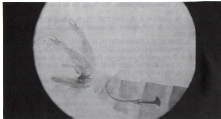
FIG. 2 - Aspecto de genitália de Lu. intermedia montada em bálsamo entre lâmina e lamínula