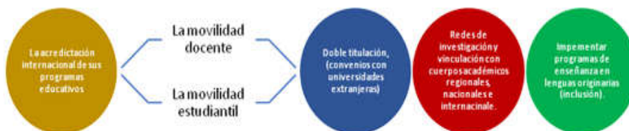
Figura 1 – Esquema: acciones para impulsar la internacionalización en la UNACH

En este documento se hace un estudio profundo y extenso sobre datos que permiten reconstruir la historia de la internacionalización en México y en Chiapas. De acuerdo a los datos presentados en el Programa Indicativo de Internacionalización 2030 , la UNACH se encontraba para 2018 en el World University Rankings (QS) y en el Ranking Web de Universidades (Webometrics) , en la posición 39 de “las mejores universidades de Chiapas” (2018, p. 80-81), por lo que una de las acciones a impulsar por la universidad para mejorar su estatus dentro de este ranking fue el de “incrementar su visibilidad en el contexto mundial”, a partir de lograr: