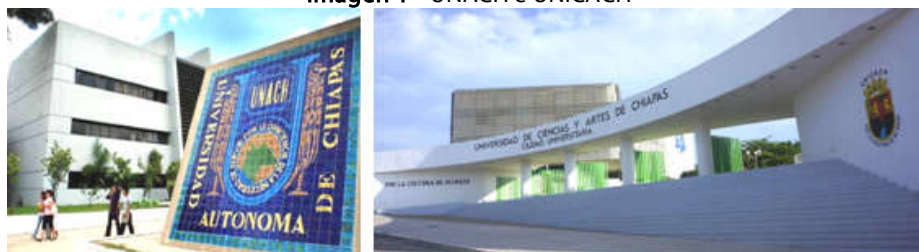
Imagen 1 - UNACH e UNICACH