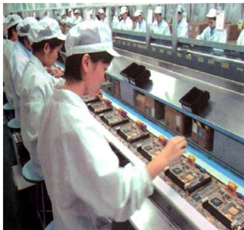
Figura 1- Linha de produção de placas de computador (Shenzhen, Guangdong – China, 2003).