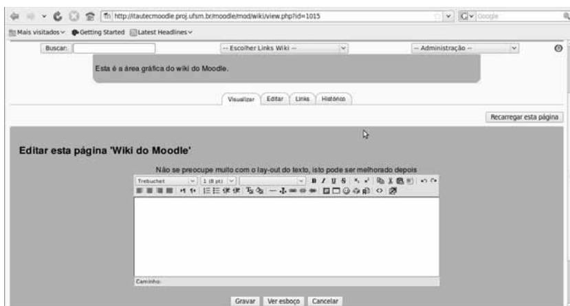
Figura 1: Área gráfica do ErfurtWiki do Moodle

Na Figura 1, mostramos a área gráfica da versão standard do wiki do Moodle e podemos conferir que sua aparência é muito próxima à de outros editores de textos. Além disso, podemos perceber, também, que essa versão dispõe de quatro abas de recursos: Editar, Visualizar, Link e Histórico e os botões de Gravar, Ver esboço e Cancelar, localizados logo abaixo da área de edição.