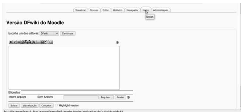
Figura 3: funcionalidades do DFWiki do Moodle