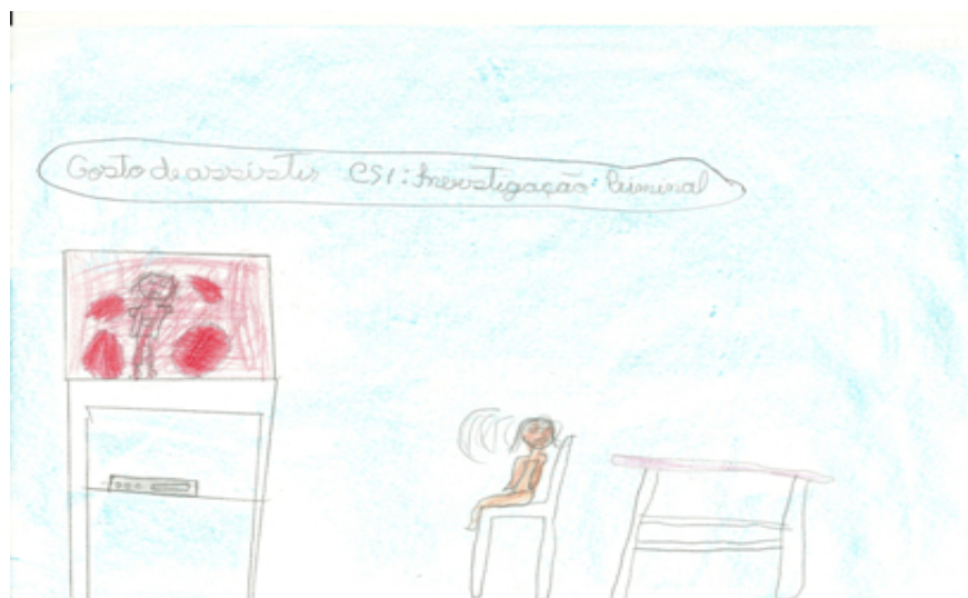
Figura 2: A telespectadora

Os brinquedos mais vendidos são aqueles que são objeto de campanhas publicitárias televisivas (BROUGÈRE, 2000). De acordo com o formulário de práticas culturais e consumo de mídias, todas as crianças disseram ter aparelho de televisão em casa. Assistir à televisão é uma das atividades preferidas pelas crianças, como mencionado acima.