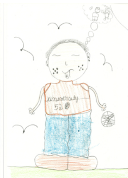
Figura 6: O jogador de basquete

Girardello (1998) disse que a imaginação é uma dimensão por meio da qual as crianças reagem às novidades do mundo, pressentindo ou esboçando possibilidades futuras. Sugeriu que é, por meio do imaginário, presente em brincadeiras, desenhos e diálogos que as crianças buscam elementos para enfrentar o desconhecido, moldando suas representações de acordo com suas expectativas. Percebemos que o mundo demonstrado pela mídia é refletido na corporeidade das crianças, tal como Wiggers (2005), que evidenciou a estreita relação entre mídias e representações corporais no universo infantil.