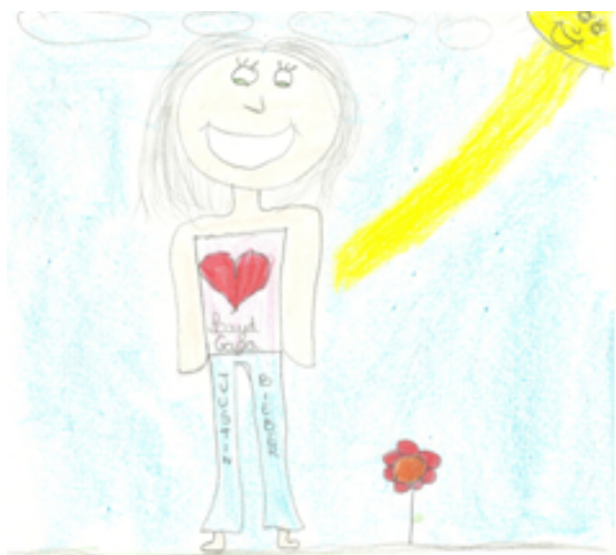
Figura 5: A fã