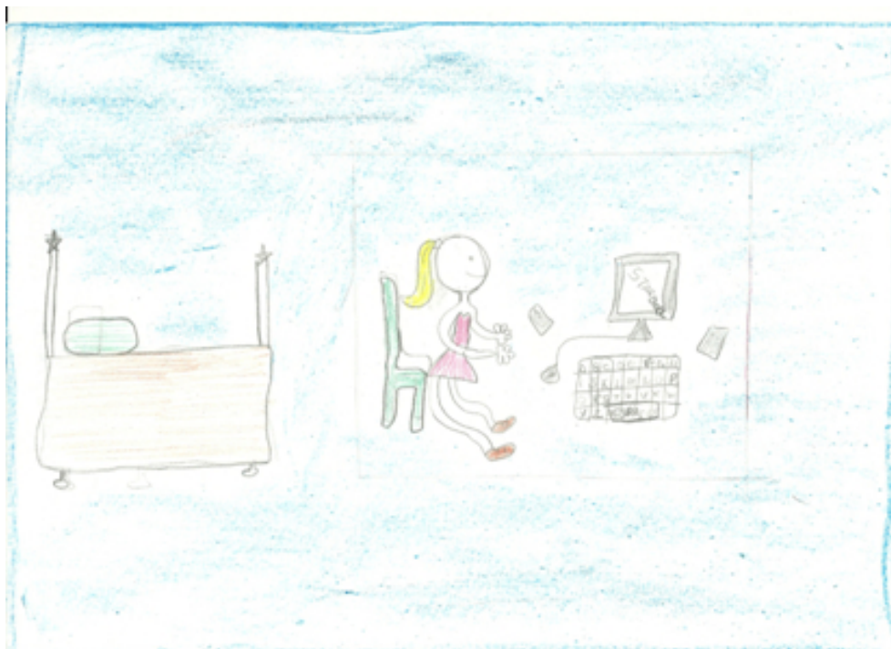
Figura 1: A bonequinha

Entre as brincadeiras feitas em casa se destacaram o “computador” e a “televisão”, que atingiram 41% e 23% das respostas ao formulário de práticas culturais e consumo de mídias, respectivamente. Estas respostas também se evidenciaram nos desenhos produzidos pelas crianças, conforme ilustram as Figuras 1 e 2.