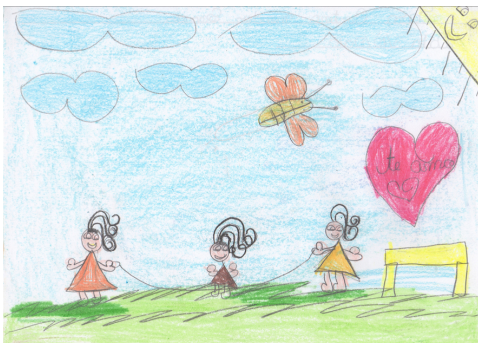
Figura 3: Pulando corda na escola

Eu desenhei eu pulando corda. Desde pequena minha irmã me ensinou. É o que eu mais gosto de fazer na escola (Menina, 8 anos, autora da Figura 3).