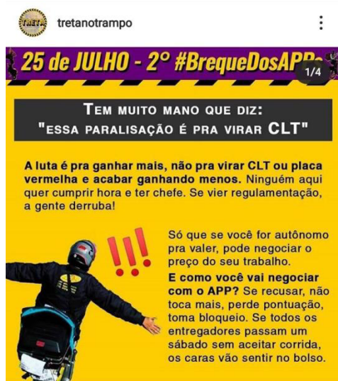
Figura 1 – Informe digital #brequedosapps