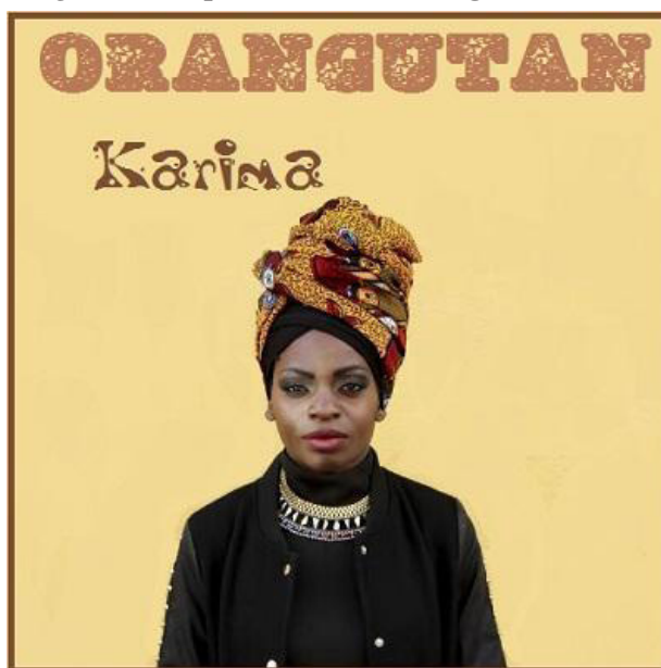
Figura 4: Capa de Karima, Orangutan (2014).

Não há dúvidas de que Karima expressa numa forma agressiva a afirmação duma dignidade feminina e africana na Itália e na Europa, derivante de experiências pessoais, assim como coletivas. Elementos biográficos duma vida difícil se juntam com a luta pelo reconhecimento do Ius soli , princípio fundador do novo direito de cidadania italiano. “Tinha seis anos quando fui chamada pela primeira vez negra , nove quando respondi aos insultos e treze quando começaram as primeiras agressões dos colegas de escola”, confessa numa entrevista (Sanzone, 2014, on-line ). Esta cantora expressa a sua subjetividade mediante um grito de protesto, aberto e claro “contra um país que não reconhece como italianos os que nascem aqui de famílias estrangeiras” (Sanzone, 2014, on-line ), mas procurando sempre a sua unicidade como ser humano e artista. Duma forma muito consciente, declara: “Eu pertenço e represento este resultado” 4 (The Black Blog, s.d., tradução nossa). Como para o caso de Issaa, para Karima também a música representa uma via de salvação, expressão, purificação, mediante a qual tornar público o racismo presente na Itália contra os imigrados, principalmente africanos (Sefa-Boakye, 2014).