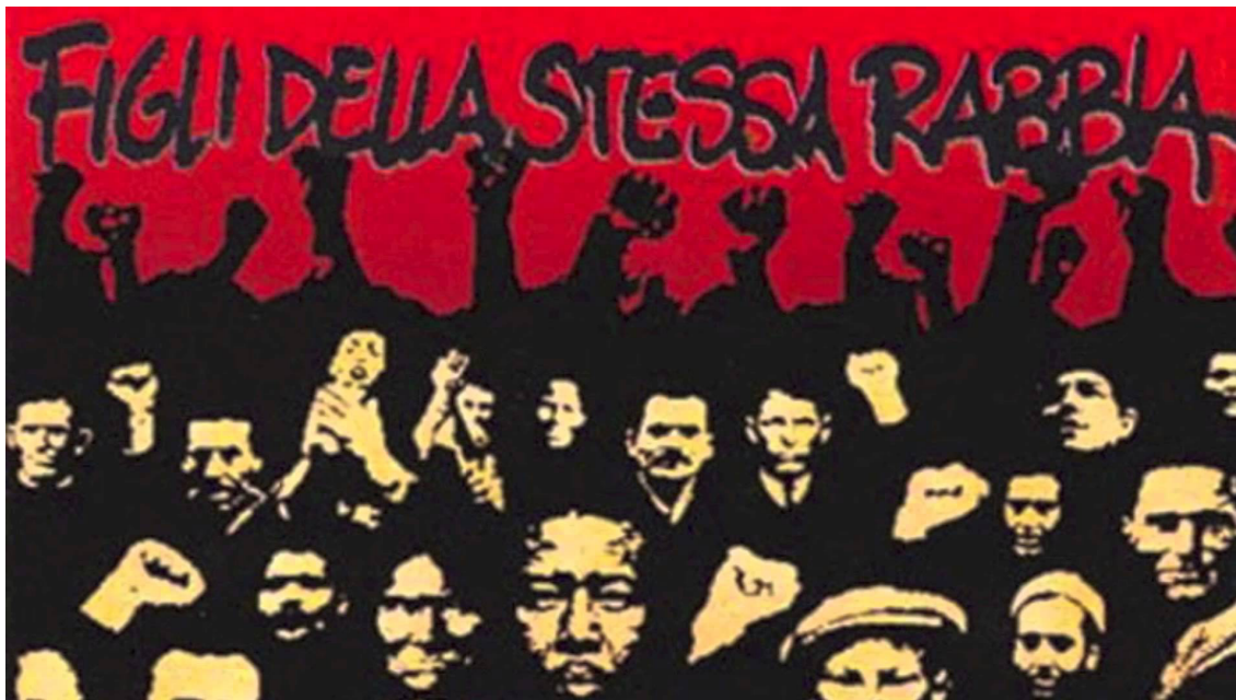
Figura 2: Capa de Banda Bassotti, Figli della stessa rabbia (1992)