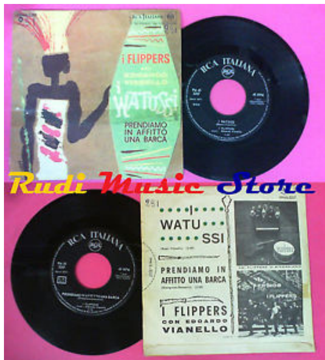
Figura 1: Capa de E.Vianello, I Watussi (1963)