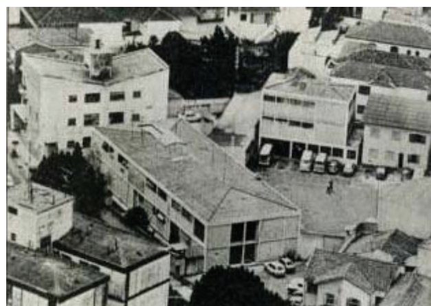
Figura 9. Imagem aérea do DOI-Codi de São Paulo, reconhecido centro de torturas. 16

Ao contrário dos exemplos vindos do Chile e da Argentina, o Estado brasileiro ainda não reconheceu oficialmente – tornando-os públicos – esses lugares. Só recentemente, com os movimentos sociais organizados pela juventude e aqueles ligados aos direitos humanos, é que a sociedade passou a reconhecer alguns dos lugares usados pelos organismos de repressão. Nas Figuras 9 e 10 relembramos dois desses lugares.