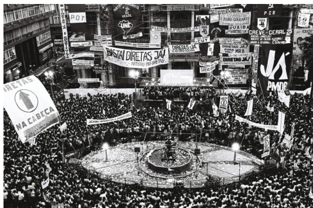
Figura 4. Comício pelas Diretas Já! em Porto Alegre. 8

A participação do MJDH nas campanhas das Diretas Já e da Constituinte soberana ocorreu em uma política “de frente” com outras entidades, contando com a participação de parte da sociedade política. Tal forma de ação retomava, em nível regional, as estratégias dos demais movimentos em defesa dos direitos humanos organizados em quase todos os estados da Federação. Já agonizante, a ditadura militar fez o que pôde para impedir a aprovação da emenda pelas eleições diretas pelo Congresso Nacional. Os governos militares consideravam o voto universal um risco tão profundo quanto as presumíveis intenções comunistas do governo Goulart em 1964.