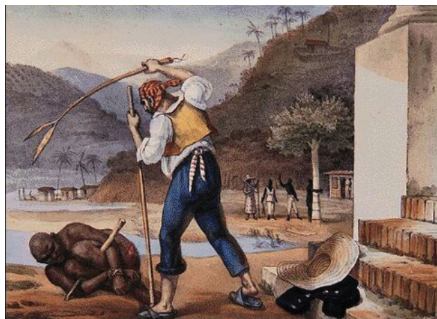
Figura 1. Quadro Debrete retratando o que depois viria a ser chamado de pau de arara. 2

Este texto trata especialmente da história do MJDH e de suas ações para a reorganização da sociedade civil regional, nacional e latino-americana. O texto está organizado em três partes interligadas: a primeira recupera a origem do movimento e das lutas em defesa dos perseguidos políticos; a segunda trata da participação do MJDH nos movimentos de redemocratização e reorganização da sociedade civil; e a terceira parte aborda a participação do movimento nos debates e nas ações que dizem respeito às diferentes experiências vividas na América Latina, no que tange ao campo de disputas políticas sobre a reconstrução da memória, da verdade e da justiça.