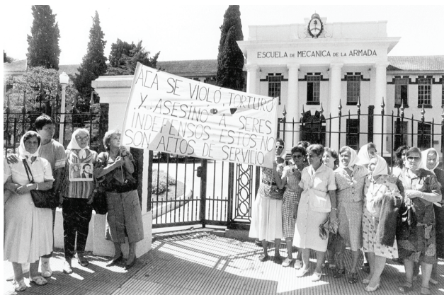
Figura 7. Escuela de Mecánica de la Armada (ESMA) centro de torturas durante a ditadura argentina. 14

A imagem da Figura 8, a seguir, simboliza uma das práticas mais cruéis da ditadura argentina: o rapto das crianças nascidas nos cárceres, sequestradas das prisioneiras logo após o nascimento e nunca devolvidas para seus familiares. Tal ato de barbárie e terrorismo deu origem ao movimento das Madres de Praça de Mayo – chamadas pelos militares daquele período