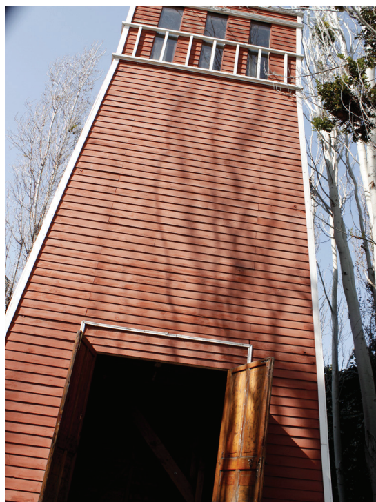
Figura 5. Torre, local de tortura durante a ditadura chilena. 12

Na Argentina, hoje são reconhecidos aproximadamente trinta centros de tortura, localizados em “trecentos e cuarenta lugares de detención en los 2.766.889 kilómetros de la superficie del país. Solamente la sede de la Escuela de Mecánica de la Armada (ESMA) de la Marina, situada en Buenos Aires, albergó cinco mil prisioneiros” (Mariano, 1998, p. 28).