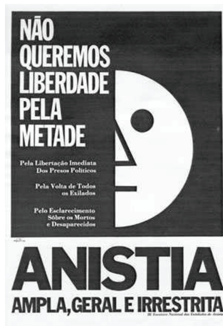
Figura 3. Cartaz da Campanha pela Anistia. 6

A partir da pressão do movimento social, a anistia votada não foi ampla nem plena, mas também não foi uma simples permissão do governo militar em benefício dos seus. A anistia marcou a liberalização do regime e forneceu as bases da movimentação que permitiu um novo patamar de lutas em defesa da redemocratização. O projeto de anistia proposto