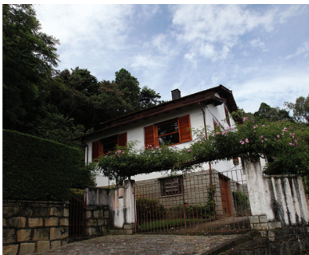
Figura 10. Casa da Morte, centro de torturas em Petrópolis (RJ). 17

Os golpes de Estado suprimiram a incipiente experiência de democratização que alguns países da América Latina ensaiavam desde meados do século passado, inserindo o continente no processo de globalização do capitalismo. Para alcançar o êxito esperado, construíram uma estratégia política que incluía: