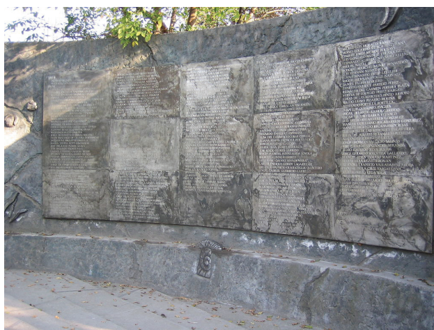
Figura 6. Memorial pelo mortos e desaparecidos na Villa Grimaldi, Chile. 13

A Escola Superior de Mecânica da Armada ocupa uma ampla área na região de Palermo, nas margens do Rio da Prata. Sede da Marinha argentina, foi denunciada como centro de tortura. Com a democratização, foi transformada em Museu da Memória, sendo, atualmente, administrada por organizações de direitos humanos, como o Centro de Preservação da Memória e da Verdade. Da ESMA saíram os – tragicamente conhecidos – voos da morte, que lançaram ao mar mais de dois mil prisioneiros ainda vivos.