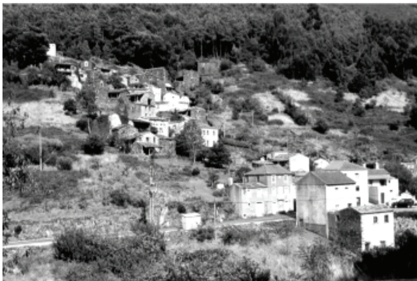
Figura 2 – Aldeia do Candal (Serra da Lousã, Cordilheira Central Portuguesa)

da antiga Casa do Cantoneiro da Fonte Fria, que consiste na recuperação de um edifício estrategicamente localizado na serra, tendo em vista aproveitá-lo como estrutura multifuncional de apoio à protecção do ambiente e como casa-abrigo. Outro exemplo é a recuperação de uma casa serrana na aldeia do Candal (Figura 2), como parte do projecto “Ecomuseu da Serra da Lousã”. O objectivo é utilizar a casa como espaço de dinamização da localidade, em termos sociais e culturais. Também a antiga escola primária de Vale de Nogueira foi transformada em centro de convívio com fins sociais, recreativos e culturais, uma iniciativa da comissão de melhoramentos da aldeia. Destaca-se ainda a beneficiação das áreas pedonais (caminhos interiores da aldeia) do Talasnal. A recuperação de antigos moinhos hidráulicos ao longo da Ribeira de Alge, concretamente nas Fragas de São Simão (Figueiró dos Vinhos), como ponto de partida para a criação de um percurso pedestre, e a instalação de um pequeno núcleo museológico subordinado à temática “da azeitona ao azeite” e situado em Castanheira de Pêra, no cenário “natural” majestoso do Poço do Corga, representam outros exemplos de projectos apoiados pelo LEADER na área do património.