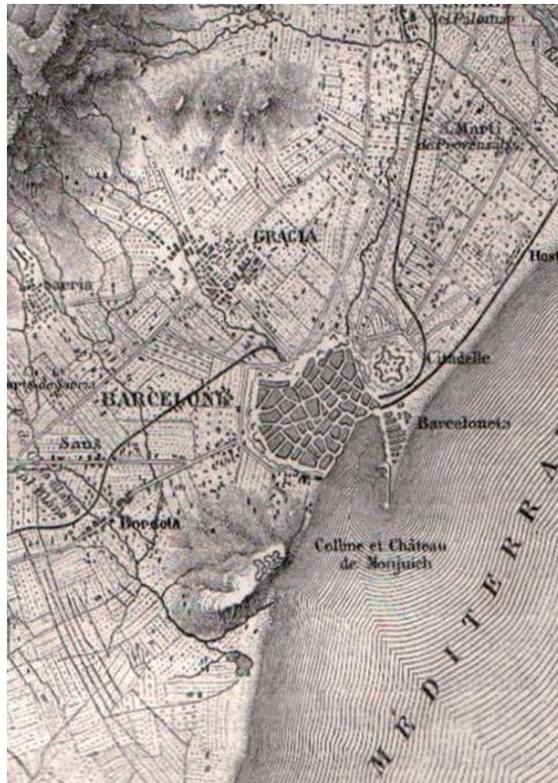
Figura 2 - Mapa de Barcelona

la ciudad propiamente dicha está sentada no bordo del mar, a la base oriental de la roca de Montjuich, erizada de fortificaciones amenazadoras, que vomitaron hierro más veces sobre los Barceloneses mismos que sobre los enemigos. Además, una poderosa ciudadela, igual en superficie a un tercio de la ciudad, la controla del lado del este. Sin embargo, la ciudad es muy alegre, mismo bajo esas baterías que podrían reducirla en cenizas. (p. 837)