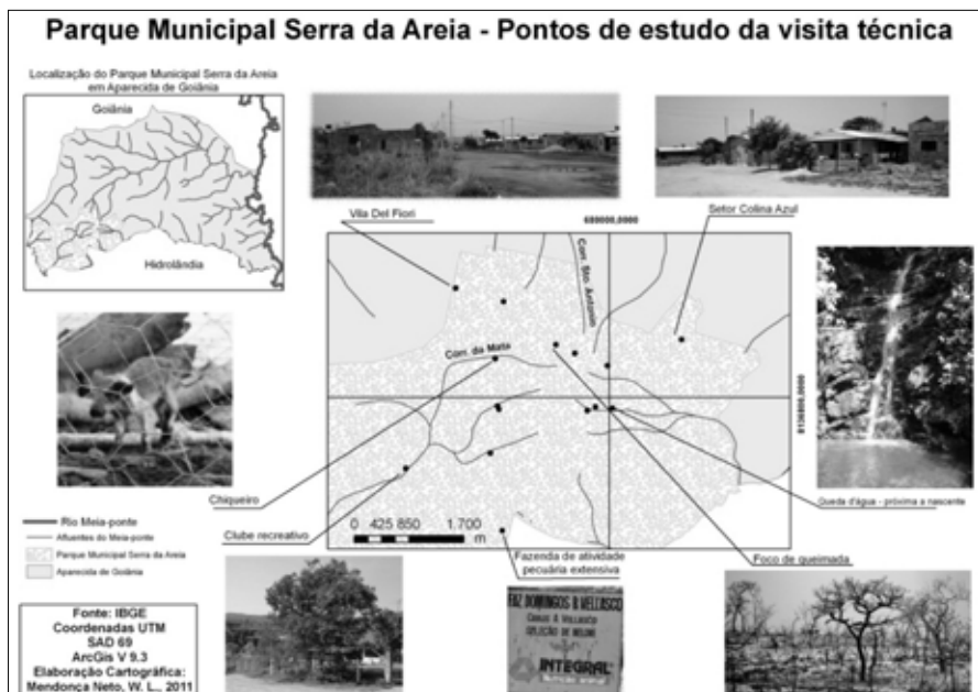
Figura 2 - Pontos visitados e problemas identificados no Parque Municipal Serra da Areia em Aparecida de Goiânia, GO.

No caso dos loteamentos construídos na área do Parque anteriores à Lei Municipal n. 2.018, a prefeitura de Aparecida deve ressarcir os moradores ou, firmar um acordo que beneficie os atingidos. Já no caso de loteamentos posteriores à referida Lei, tanto a prefeitura quanto as empresas responsáveis pelas obras dentro da área do Parque são culpadas e são obrigadas a realizar acordo para a indenização de moradores desses loteamentos. Essa responsabilidade deve ser compartilhada entre ambas uma vez que, por um lado, a prefeitura não deveria ter liberado a licença para a construção dos loteamentos, e, por outro, as empresas deveriam ter realizado estudos de impacto ambiental que identificassem a importância dos mananciais do Parque e os níveis de vulnerabilidade ambiental decorrentes do empreendimento.