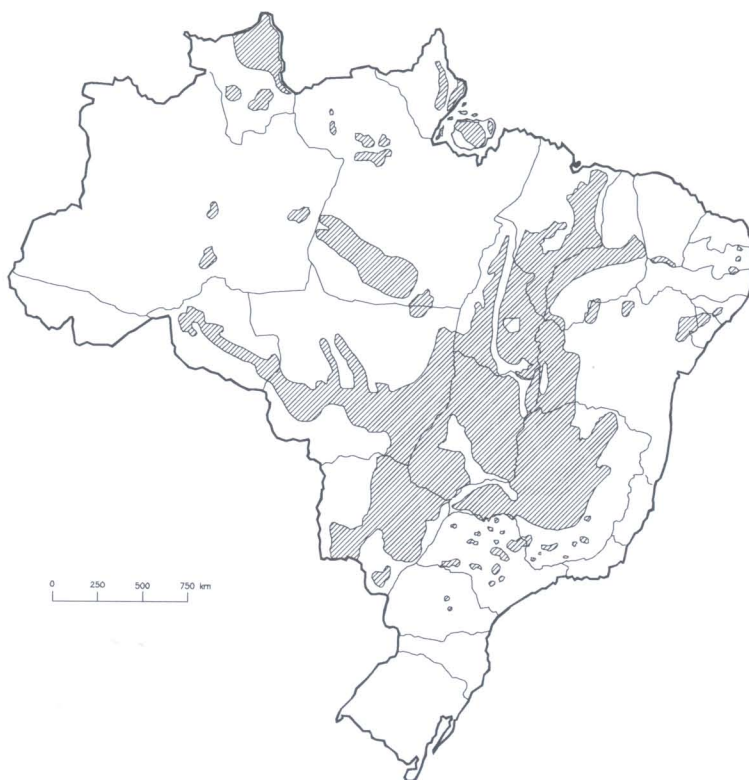
Figura 1 - Brasil: áreas ocupadas por cerrado, 2000. Fonte: FIBGE, 1993. Digitalização: Celso A. Siqueira

Essas transformações recentes permitem-nos pensar numa redefinição dos papéis urbanos, tanto no que se refere à metrópole e sua região como no que diz respeito às cidades grandes e médias, que passam a constitui pólos regionais ou metrópoles regionais, assim como com relação às pequenas, que transformam-se em cidades do campo.