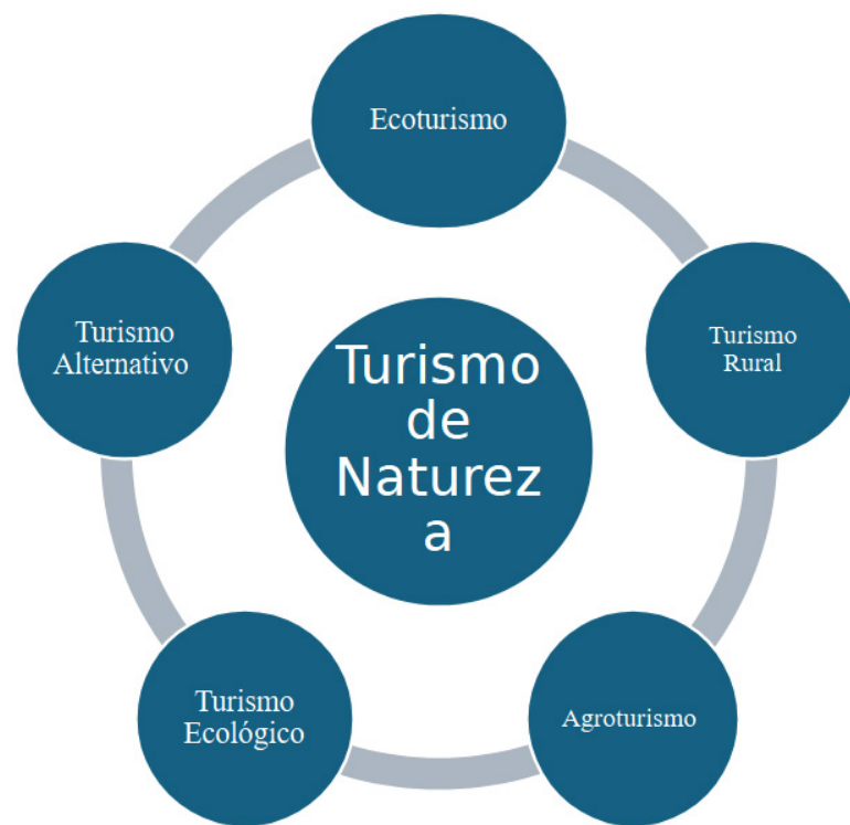
Figura 01: Segmentos ligados ao turismo de natureza