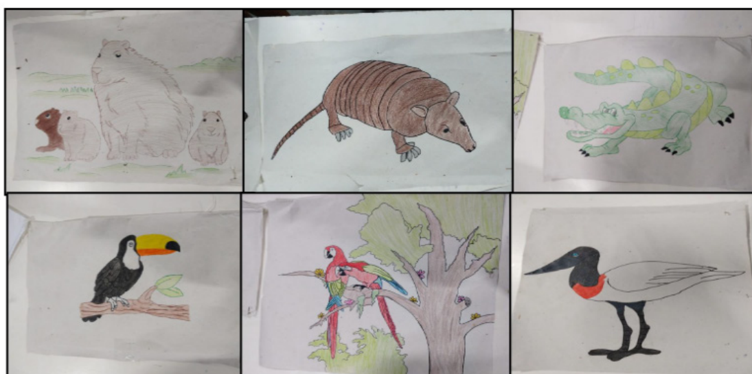
Figura 2: Contornos livre