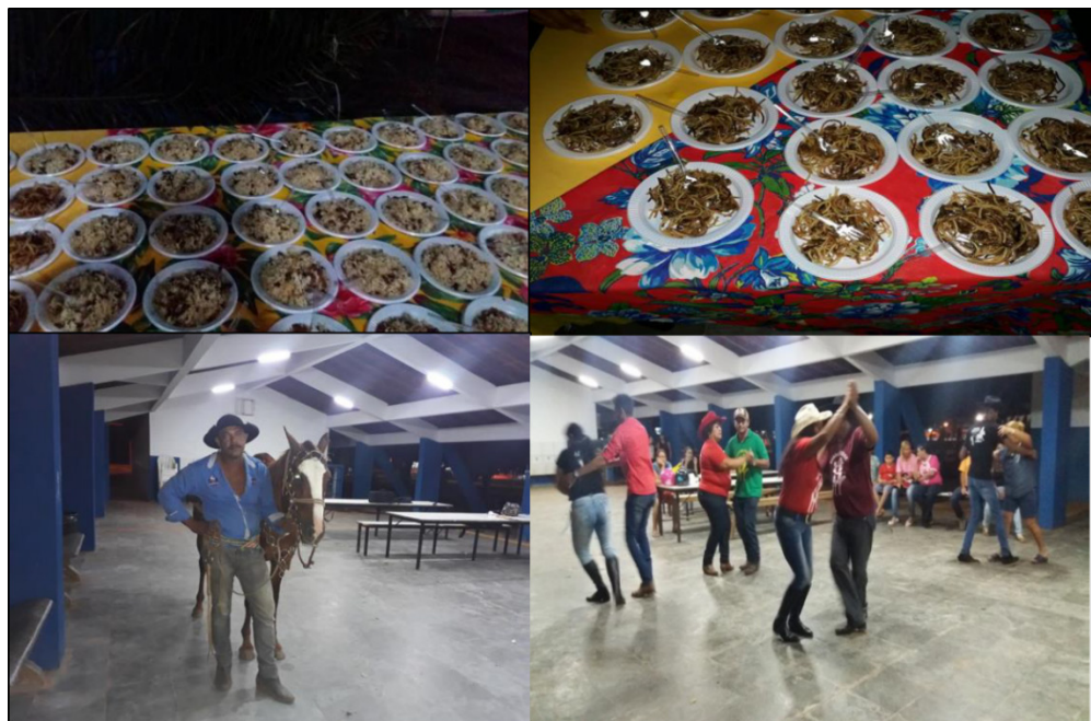
Figura 3:Noite cultural Pantaneira

Associado à solenidade, transcorreu degustação da culinária de comitiva (arroz carreteiro e macarrão tropeiro), representação e exposição de uma minicomitiva para montaria, apresentação do grupo baileiro que fez a demonstração da dança típica dos bailes pantaneiros carapés, chamamé e o rasqueado. (Figura 3).