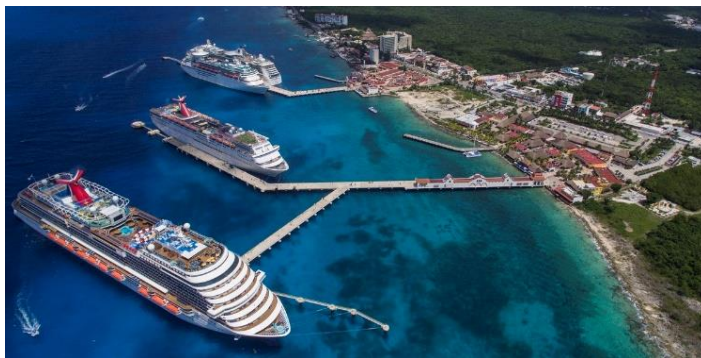
Figura 3: Marina Cozumel – Terminal de cruceros

Ahora bien, no son solamente los hoteles y parques temáticos que representan la urbanización extensiva del turismo, las infraestructuras de comunicación y transporte para conectar los turistas a los destinos turísticos, también hacen parte de este proceso (ver Figura 3). El turismo tiene la necesidad imperante de contar con vías de comunicación para su implementación - construcción de carreteras, aeropuertos, puertos, marinas - de manera que contribuye no apenas para la absorción del excedente de capital, pero también para una mayor integración espacial, reduciendo las barreras físicas a la circulación de capital sobre el espacio, anulando el espacio por el tiempo (MARX 1973, citado por HARVEY, 2005). Como menciona Paiva (2013) el turismo representa y materializa la dilución de las barreras del espacio y del tiempo en la contemporaneidad, siendo que una de sus principales manifestaciones espaciales es el proceso de urbanización.