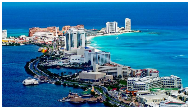
Figura 5: Zona hotelera de Cancún

Vemos entonces una asociación entre turismo y dinámica inmobiliaria, que intensifica el proceso de urbanización a lo largo de la zona costera (PONTES et al., 2020). El desarrollo inmobiliario en la primera línea de playa modela el crecimiento de las ciudades a partir del estímulo a la expansión del turismo residencial que amplía la oferta extra-hotelera a partir de la construcción de conjuntos de vivienda para residentes temporarios y/o segundas residencias (BAÑOS, 2012). El consumo turístico y la práctica de ocio han generado la producción de espacio urbano, que ha sido una de las formas de posibilitar nuevas inversiones inmobiliarias contribuyendo a la absorción de capitales disponibles en el mercado que encuentra en el segmento inmobiliario-turístico buenas condiciones de expansión y rentabilidad (PONTES et al., 2020).