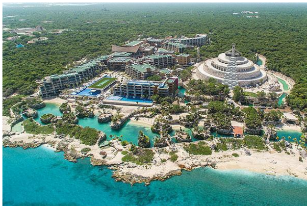
Figura 1: Xcaret-Riviera Maya

y 2), Vidanta, así como los diferentes tipos de cruceros.