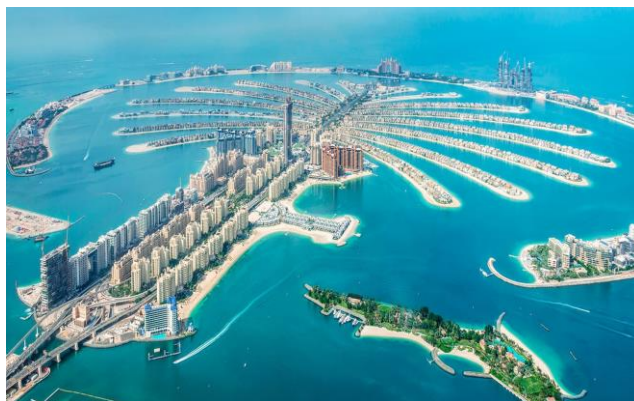
Figura 4: Islas Palm en Dubái