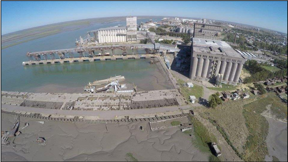
Figura 05: el muelle y su entorno en la actualidad.

Como parte de la propuesta, se establecen cuatro ejes centrales que deben ser tenidos en cuenta por los postulantes a la hora de presentar las alternativas de refuncionalización, teniendo como base no alterar el valor simbólico atribuido al muelle. En primer lugar, se destaca el vínculo de la obra con el entorno, contemplando las mareas y las zonas próximas de funcionamiento portuario; en segunda instancia, la relación del muelle con el resto de los inmuebles de valor histórico que se encuentran en el sector, principalmente con el predio del Museo-Taller Ferrowhite y la antigua Usina del Ferrocarril Sud, que son los espacios más próximos y que custodian el ingreso al predio.