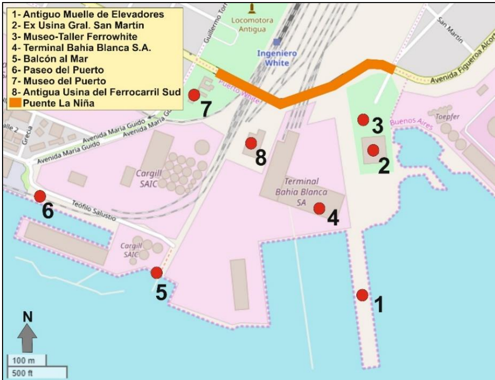
Figura 02: localización del antiguo Muelle de Elevadores y principales construcciones en el sector costero-portuario.

Elaboración: PINASSI, A; SILENZI, D. V. en base a < https://www.openstreetmap.org/ >, 2018.