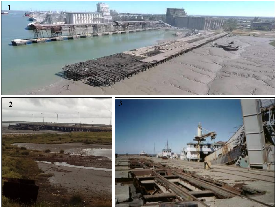
Figura 04: fotografías contemporáneas del muelle.