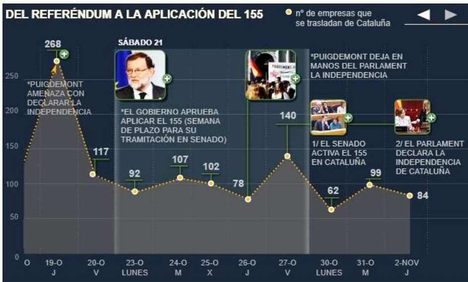
Figura 3: Relación entre los hechos políticos y el traslado de empresas de Cataluña entre el 19 de octubre y el 2 de noviembre de 2017

Fuente: Disponible en: Elaborado por los autores desde diversas fuentes de periódicos y páginas web de las empresas.