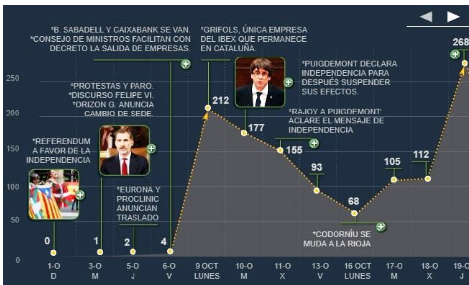
Figura 2: Relación entre los hechos políticos y el traslado de empresas de Cataluña, entre el 1 y el 19 de octubre de 2017