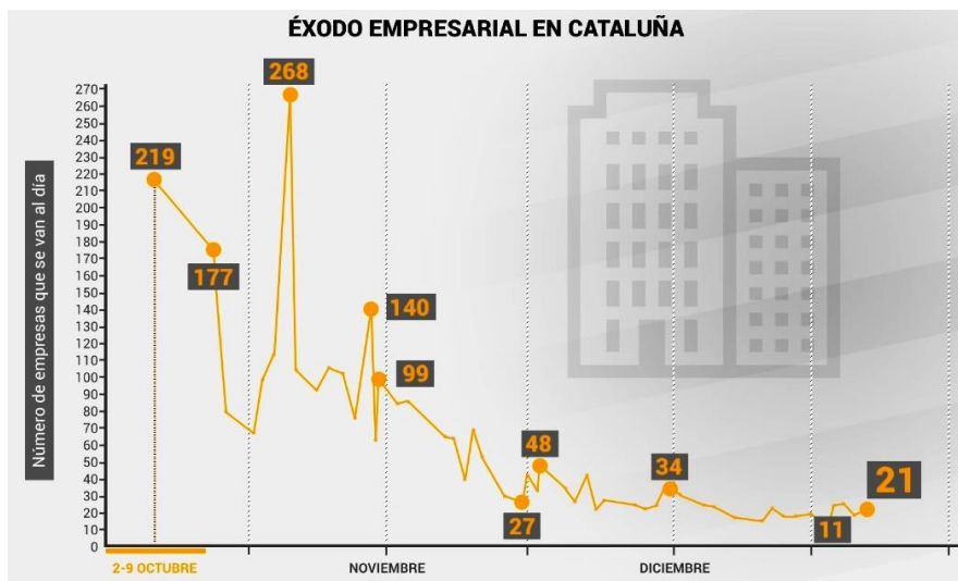
Figura 4: Éxodo empresarial en Cataluña entre 2 de octubre y 21 de diciembre de 2017

Hasta el 13 de noviembre ya habían salido de Cataluña, un total de 2.471 empresas. Durante el mes de diciembre, la fuga se ralentizó, y se marcharon unas veinte diarias. Aun así, a la fecha del 27 de diciembre el número total de empresas que salieron fue de 3.160 (SÉRVULO y MAQUEDA, El País , 14/11/2017) (figura 4).