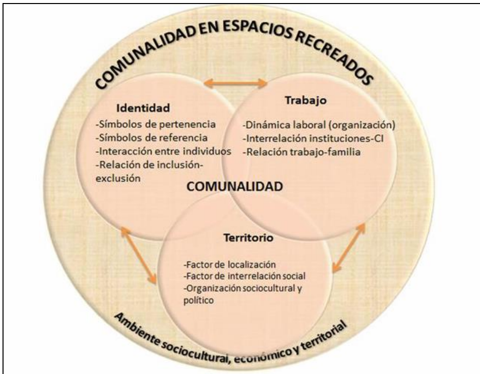
Figura 01: Elementos y unidades de análisis de la comunalidad en espacios re-creados.

integración dentro de la economía regional, los modos de producción y las relaciones de intercambio con la finalidad del beneficio colectivo o posibles relaciones o lazos. Es por ello que se debe abordar las unidades productivas en sus distintas dimensiones, las dinámicas laborales desde el contexto histórico, tanto del territorio origen como del territorio re-creado, la intervención de actores externos en la vida cotidiana, y los tipos de trabajo y percepción económica, que dichas comunidades adquieren en ese nuevo contexto social. A la vez la identificación de la relación trabajo-familia en el ámbito laboral en este nuevo contexto permite asociar ciertos patrones de conducta posiblemente adquiridos desde el territorio origen y otros asociados al devenir del proceso histórico y espacial. La articulación y análisis de los elementos de la comunalidad, se muestran en la Figura 01, indicando las categorías de análisis propuestas para cada uno de estos componentes.