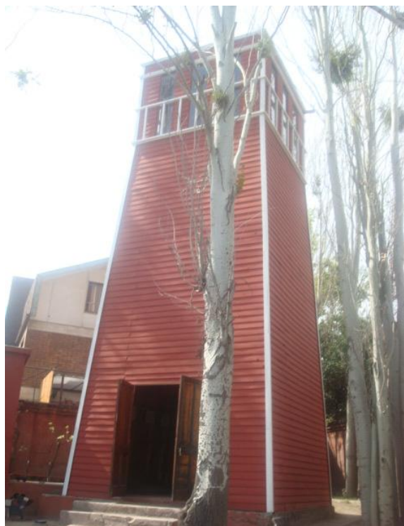
Figura 1 - La propuesta del parque está compuesta por una intervención artística, la reproducción de los espacios de tortura acompañados por los dibujos realizados por un sobreviviente, hay además una maqueta del cuartel, un jardín de rosas en homenaje a las mujeres desaparecidas de la Villa Grimaldi, varias fuentes de agua, el mural con los nombres de los desaparecidos y asesinados, un archivo de testimonios de sobrevivientes y un pequeño museo con fotografías y homenajes a las víctimas por parte de los familiares.

El Parque por la Paz ha sido pensado como un espacio para la demanda de verdad, justicia y reparación, desde la dirección del lugar lo presentan como un sitio de conciencia , donde una de sus actividades principales es la visita guiada dirigida a todo tipo de público, con un objetivo educativo, reflexivo, conmemorativo, informativo y de reparación a las víctimas.