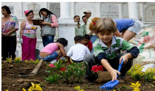
Figura 5 - Taller Arte Vivo.

En un primer momento tenían un enfoque de acompañamiento en la elaboración del duelo para las familias y poco a poco el equipo académico del museo dio un giro al proyecto y amplió los talleres a toda la comunidad buscando una mayor proyección del cementerio, como un lugar que contenía en sí mismo la historia de la ciudad de Medellín, pero cada uno de sus visitantes tenía también una memoria que podía ser compartida con otros y elaborada a través del arte.