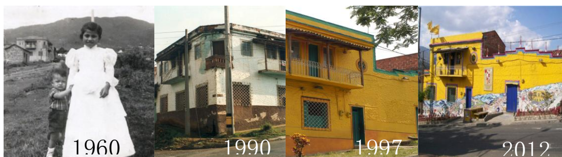
Figura 3 - Transformaciones de la fachada.

La casa se adapta a las nuevas necesidades del grupo artístico de la corporación, así las habitaciones del burdel se convierten en la biblioteca, el salón de música, danza y oficinas y el salón de baile en el escenario.