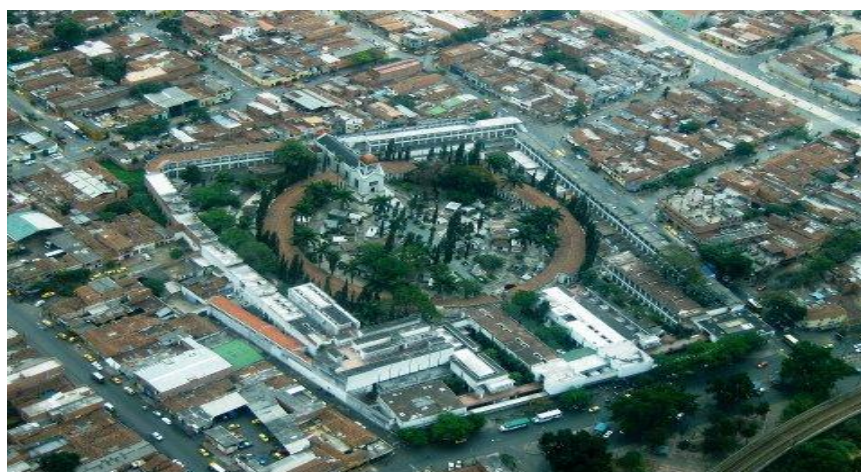
Figura 4 - Vista panorámica del Museo Cementerio.

La descripción de un periodista anónimo ilustra mejor lo que allí acontece: “El cementerio de San Pedro de Medellín, se ha convertido en un escenario más propio para los asuntos de los vivos que un remanso para el eterno descanso de los muertos. Allí es normal que la gente de serenatas, eleve cometas, tome fotos, beba aguardiente, destape fiambres, levante novia, dispare tiros, meta vicio y pare de contar...Este campo santo es lo más parecido a un barrio.” 2