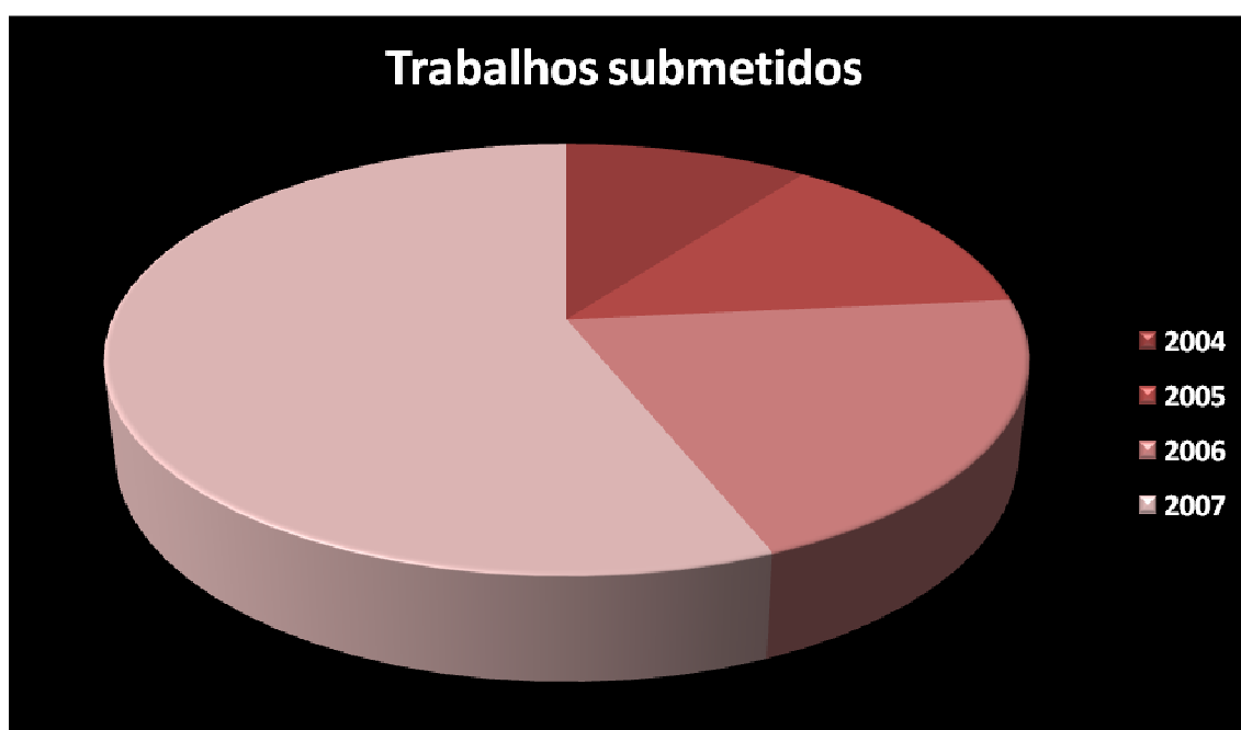
Figura 1: Crescimento da demanda de submissões de artigos a REF desde a sua criação (2004-2007).