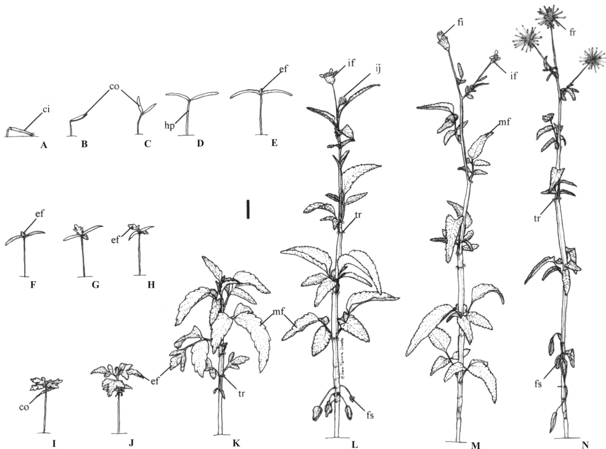
Figura 2 - Desenvolvimento pós-seminal e morfológico de plantas de picão-preto ( Bidens pilosa L.) em ambiente protegido em Cruz das Almas, Bahia, Brasil, ao longo do ciclo biológico. A. Emergência de plântulas aos quatro dias após a sementeira; B. Plântulas sem o tegumento da semente; C. Plântula expandindo os cotilédones; D. Plântula cinco dias; E. Plântula aos sete dias; F. Plântula aos 10 dias; G. Plântula aos 14 dias; H. Plântula aos 16 dias; I. Planta jovem aos 29 dias; J. Planta jovem aos 37 dias; K. Planta aos 67 dias; L. Planta aos 73 dias; M. Planta aos 75 dias; N. Planta aos 87 dias. co: cotilédono; ef: eófilo; fi: fruto imaturo; fs: folha seca; fr: fruto; hp: hipocótilo; if: inflorescência; ij: inflorescência jovem; mf: metáfilo; ci: cipsela; tr: tricomas. Barra: 1,0 cm.

Após sete dias, surgiu o primeiro par de eófilos com filotaxia oposta. Mas a sua completa expansão variou entre 14 e 29 dias (Figura 2E a 2I), quando algumas plântulas passaram a exibir a porção distal dos cotilédones avermelhadas sinalizando a dessecação desses e caracterizando o final da fase de plântula.