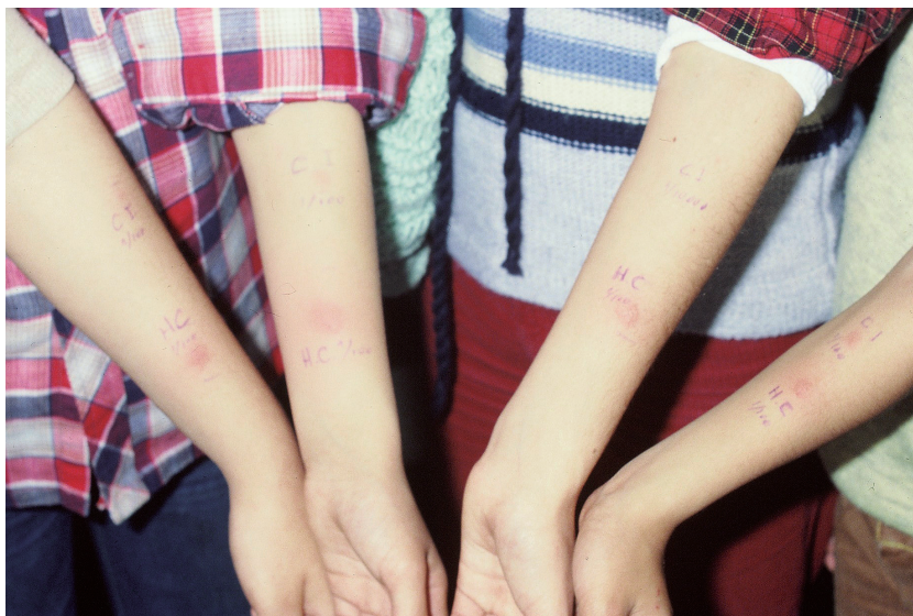
Figura 2. Pruebas cutáneas fuertemente positivas con histoplasmina.

Ninguna de las niñas recibió tratamiento antifúngico, fueron tratadas en forma sintomática y todas curaron clínicamente. Las cinco hermanas fueron controladas durante 2 años sin observarse anomalías. Ambos padres no presentaron signos o síntomas que justificaran el pedido de estudios complementarios.