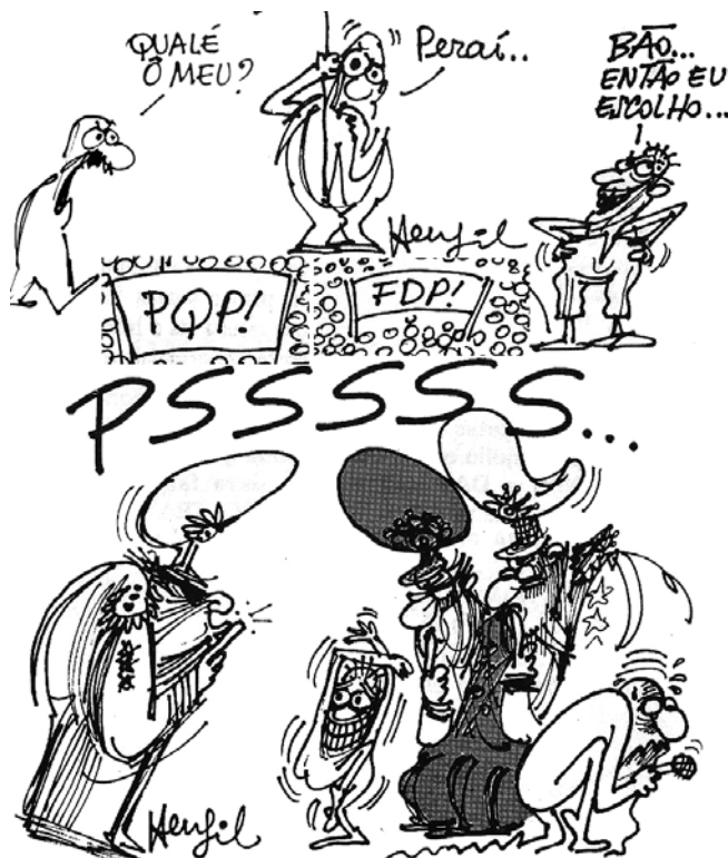
Figura 2 Colagem com detalhes de charges de Henfil: expressões.

Outra marca presente nas charges de Henfil é o tom coloquial (Figura 2).