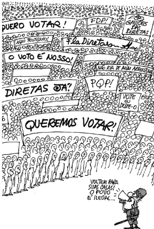
Figura 3 Charge reproduzida do livro Diretas Já! (Henfil, 1984).

do militar e nas faixas seguradas pelas pessoas temos a enunciação, a debreagem enunciva (recurso sintático).