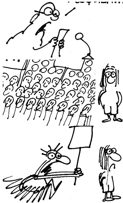
Figura 1 Colagem com detalhes de charges de Henfil: traço.

Os desenhos de Henfil se caracterizam exatamente por essa descrição feita por Barthes. Ao reproduzir uma parcela da realidade, Henfil consegue carregar suas mensagens com alto teor ideológico.