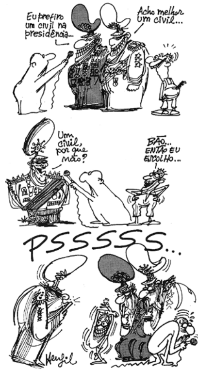
Figura 5 Charge reproduzida do livro Diretas Já! (Henfil, 1984).

A Figura 5 traz a terceira charge que iremos investigar. Assim como a anterior, ela se apresenta em um bloco de três quadros. No primeiro quadro temos quatro personagens. Na extrema esquerda há um desenho mal acabado, apenas com o número de traços suficiente para deprendermos que é uma pessoa empunhando um microfone, um repórter. No outro extremo, outra personagem rudimentar expressa surpresa. No centro do desenho, ocupando metade do quadro, duas personagens contrastando com as demais. Altos, opulentos e com um sorriso largo, estão com vestimentas militares e muitas insígnias. Ambos afirmam ao repórter preferirem um civil na presidência. No segundo quadro, novamente o repórter direciona o microfone para outro militar enquanto a personagem da direita, que havia expressado surpresa no primeiro quadro, fala: “Bão... Então eu escolho...”. No terceiro e último quadro, os militares novamente ocupam boa parte do espaço com a mão na boca, ‘pedindo’ silêncio à personagem que havia falado no quadro anterior, ação enfatizada pela onoma-