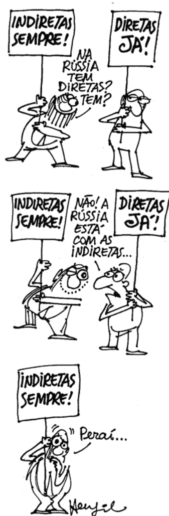
Figura 4 Charge reproduzida do livro Diretas Já! (Henfil, 1984).

martelo para criticar o que está posto e permitir a possibilidade de criar o novo, novos hábitos e novas instituições, no caso, a inclusão do povo no sistema político brasileiro.